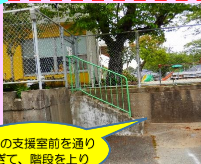
現在の支援室前を通り過ぎて、階段を上り