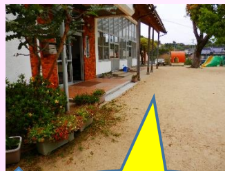
保育園部玄関前を通り過ぎて