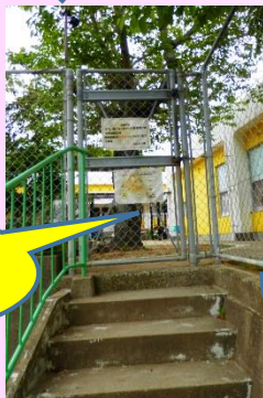
フェンスを開けて入ってください。