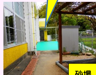
ここから入ってください