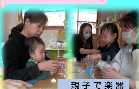
親子で楽器 (マラカス) 作ったよ♪