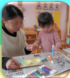
フクロウをも作ったよ!