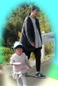
秋を探しに♡ お散歩へ行きました