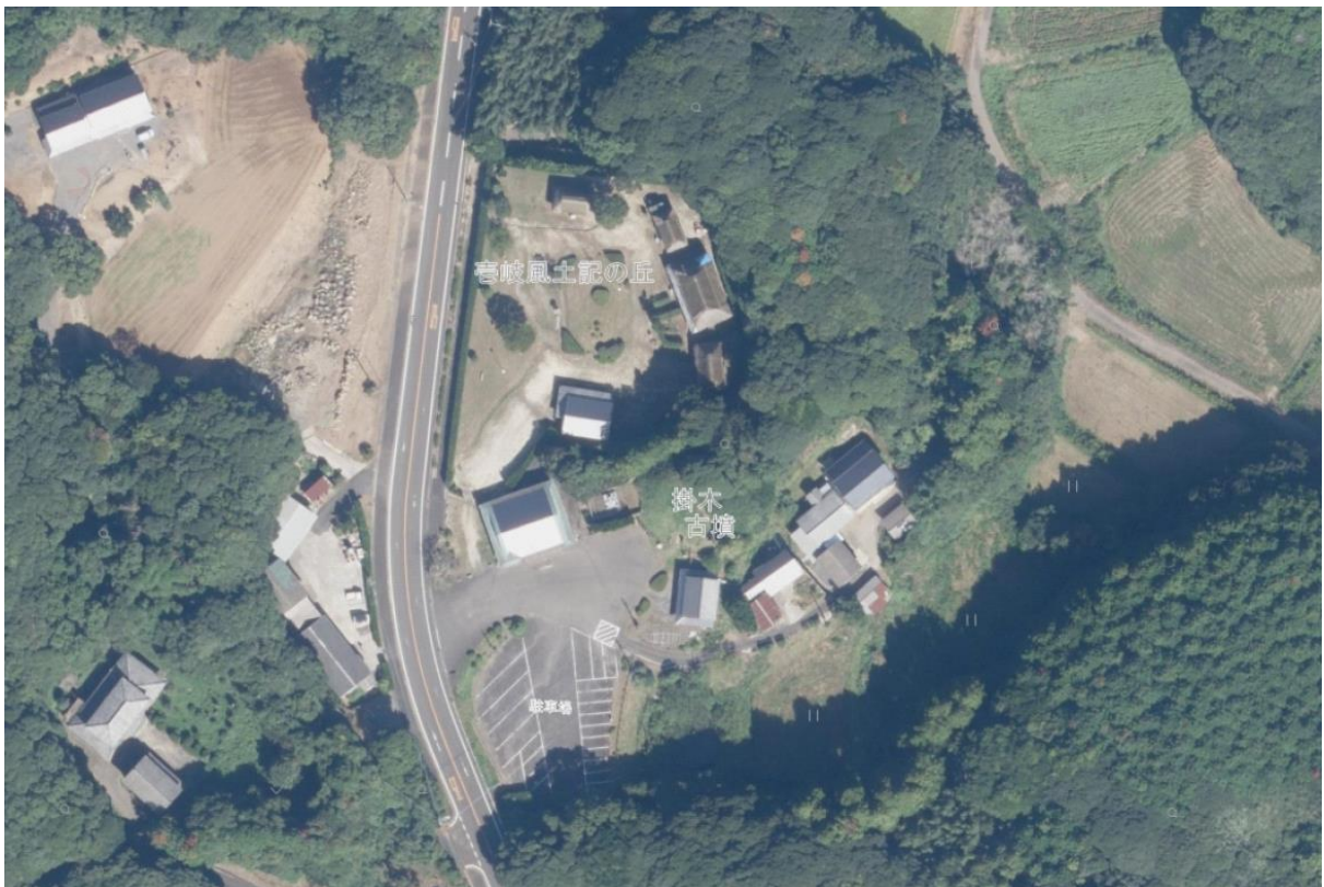
旧志岐風土記の丘位置図