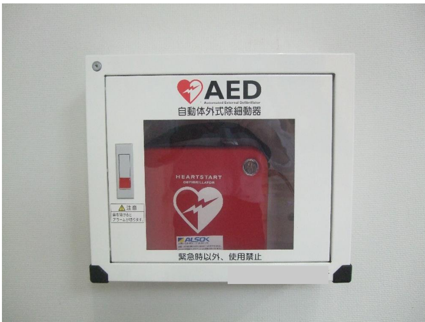
既存設置収納ボックス(壁付)

【参考】既存収納ボックス 規格:(幅)41.0cm×(高さ)36.0cm×(奥行)19.7cm