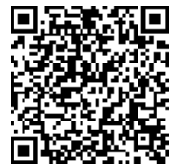
Web 回答用 QR コード

Web 回答用 URL : https://questant.jp/q/ikicitysoukeiteacher