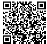
Web 回答用 QR コード

Web 回答用 URL： https://questant.jp/q/ikicitysoukei2023