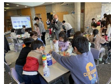
大学生が企画した探究型学習プログラム