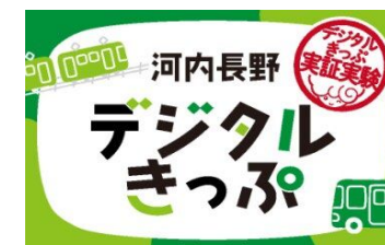
市内鉄道・バス共通1日乗車券「河内長野デジタルきっぷ」