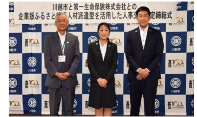
人材派遣に係る協定式 (川越市)