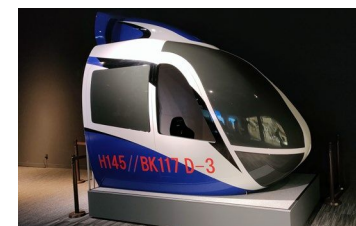
博物館内に設置したVRヘリシミュレータ