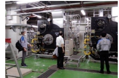
県有施設のエネルギーシフト (派遣元企業による調査)