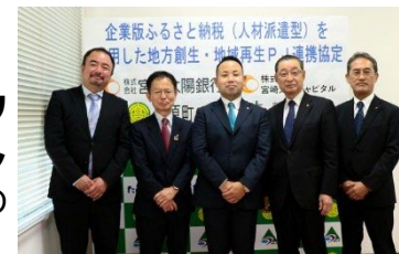
人材派遣に係る連携協定式