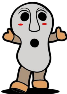
壱岐市 人面石くん