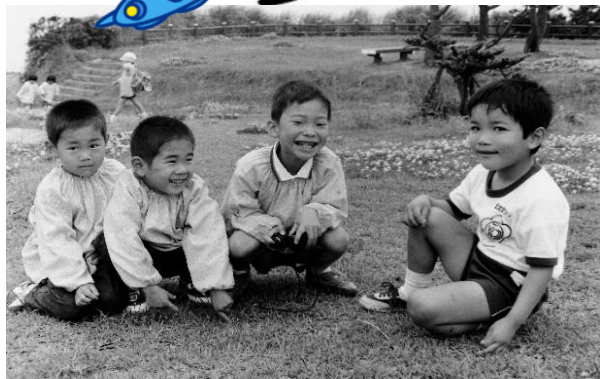
30年ほど前の瀬戸幼稚園の遠足 (少弐公園)