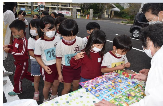
くじが余ったので幼稚園児もくじ引きしました