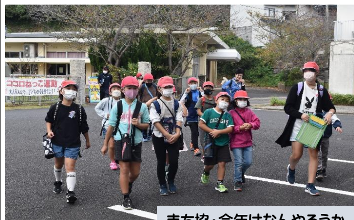
まち協・今年はなんやろうか