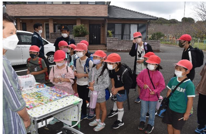
まちづくり協議会は文具のくじ引きサービス