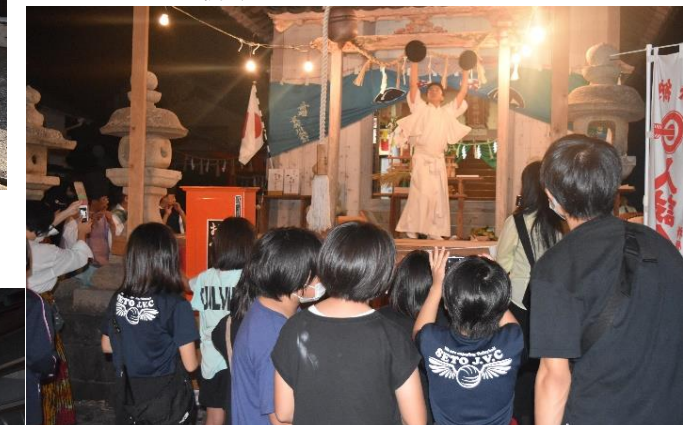
今年もたくさんの「もち」ゲット