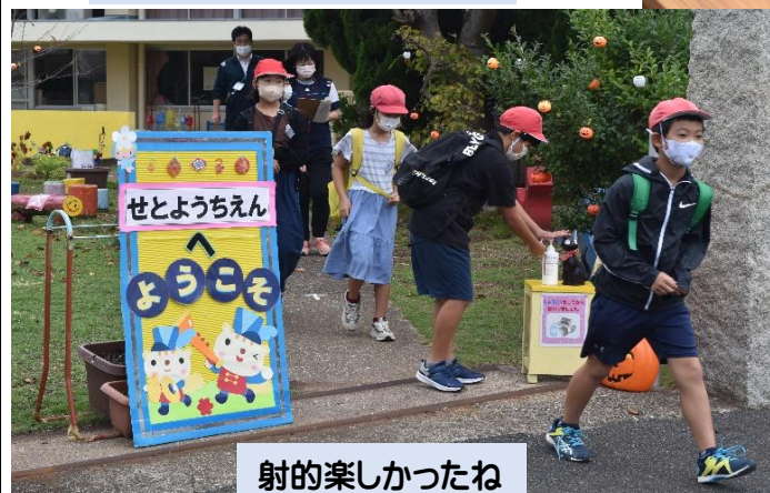
射的楽しかったね