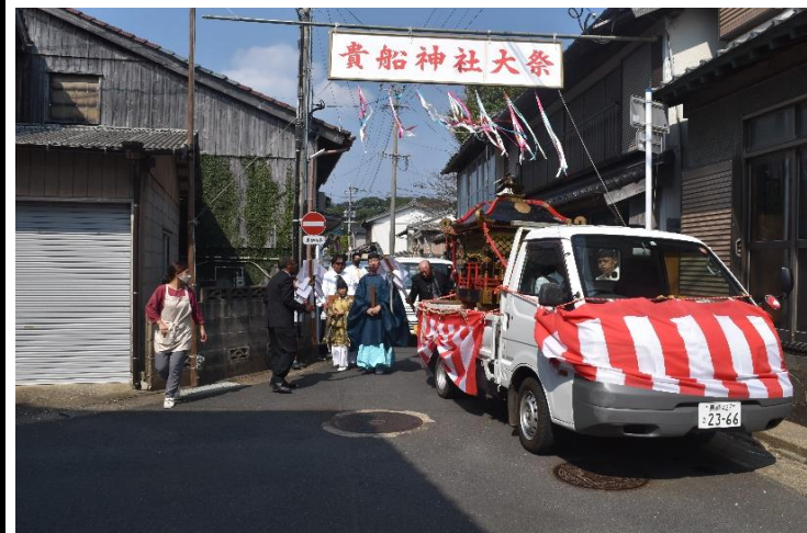
御下りスタート この日は晴天で、暑くて宮司さん・総代・社役の皆さん汗だくでした