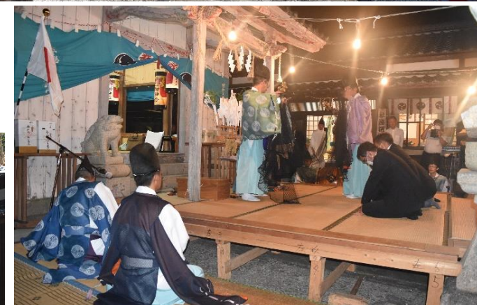
大漁祈願の神楽・魚業関係者奉納