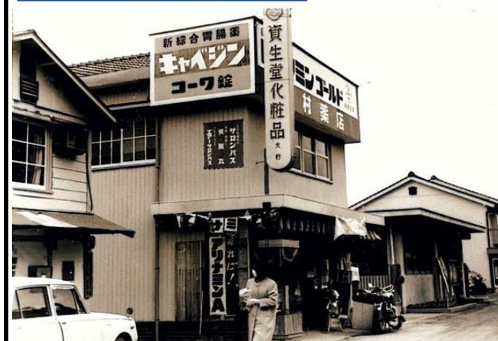
中原組 大村薬局 瀬戸郵便局は前の建物（現（株）なかはら）事務所