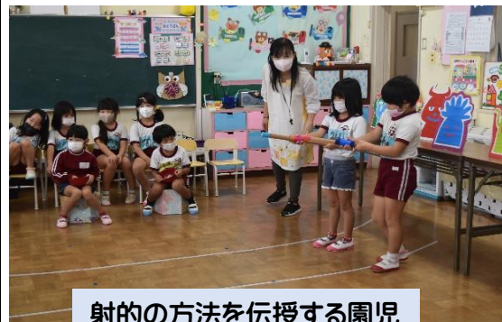
射的の方法を伝授する園児