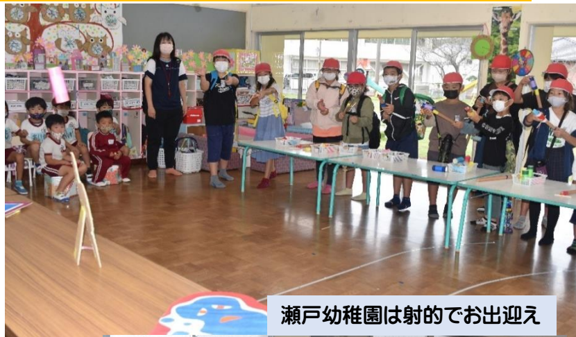
瀬戸幼稚園は射的でお出迎え