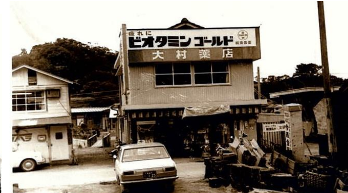
瀬戸タクシーもヤクルトの建物もまだありません