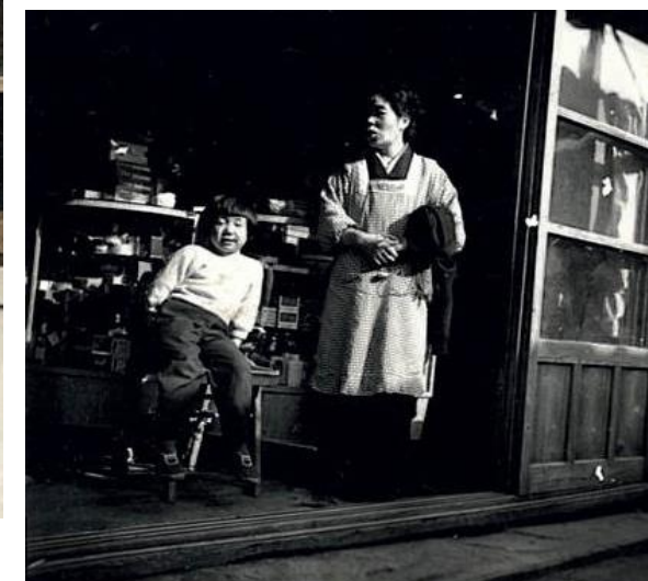
現在地へ移転する前の大村薬局（今は空地）