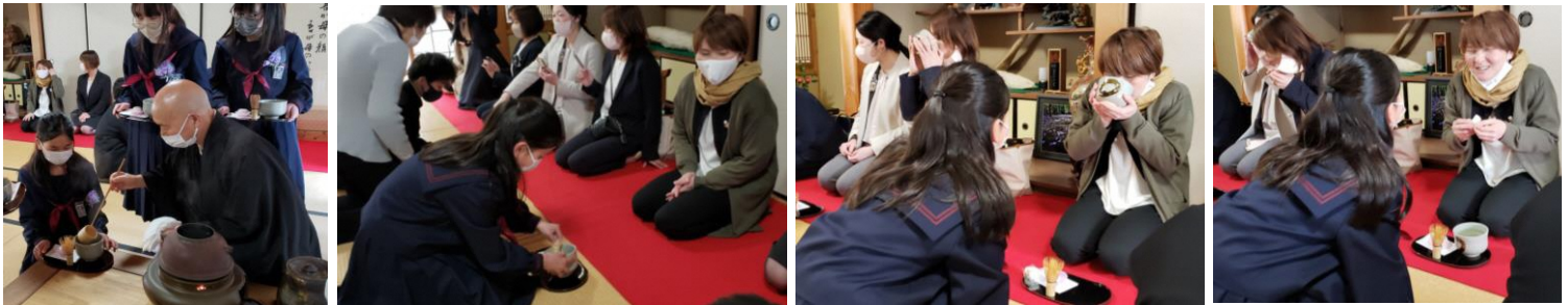
お湯を入れていただいて 心を込めて丁寧に… どう?美味しくできて? 喜んでもらえました(*^^*)

コロナ禍でもずっと続けられてきた卒業式後の茶話会。子供たちからお父さんお母さんへの感謝の気持ちを伝えるために、子供たちが毎回頑張ってお抹茶を点てておもてなしをします。先月西福寺さんの茶道教室でしっかりとお抹茶の点て方を教えていただいているので、今年はいつもとより更にスマートなおもてなしができました。