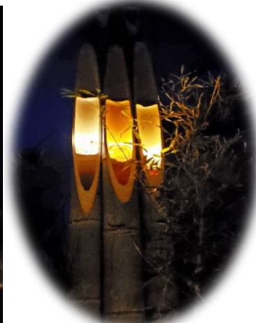
中にかくや姫が 座っていそうです