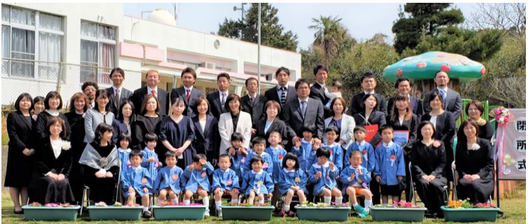
先生方と保護者のみなさんと

そして子供たちから先生へのお花の贈呈があったり、先生たちから紙吹雪で送り出していただいたりと、本当にいつまでも心に残るであろう閉所式となりました。