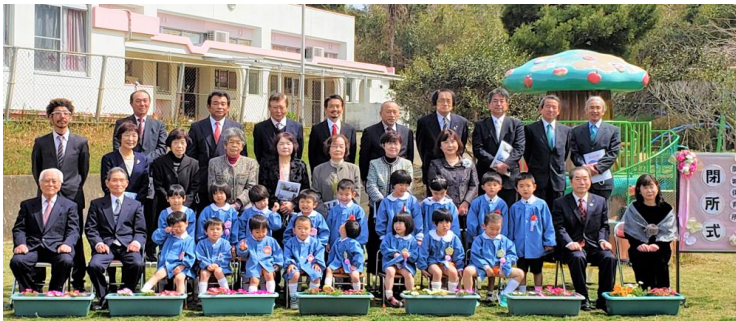
来賓のみなさんと

式典のあと、まるで子供たちを応援するような美しい青空の下で記念撮影をすることができました。