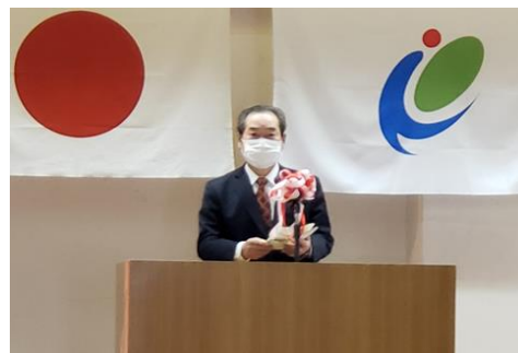
白川市長のご挨拶