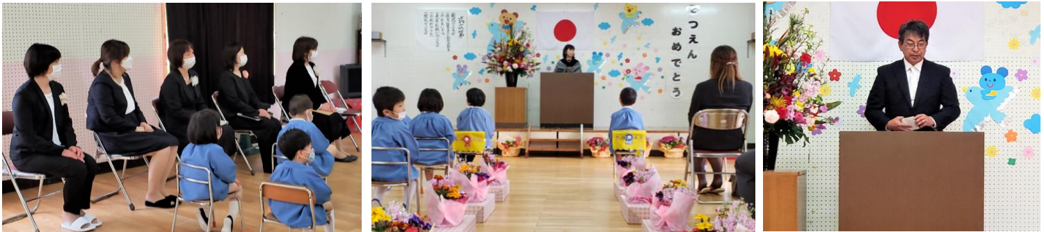
多分子供たちよりも緊張していた先生方(笑)

ひとりずつ名前を呼ばれて壇上に上がると園長先生から卒園証書を手渡され、保護者席の方に向き直ってしっかりと口調で将来の夢を発表します。そして会場の真ん中で待っているお父さんやお母さんに卒園証書を手渡すと、みんなホッとしたような表情になりました。緊張していたのでしょね(*^-^*)。