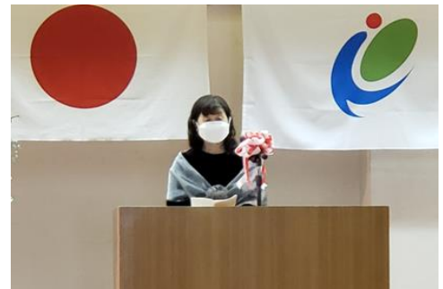
園長先生のご挨拶