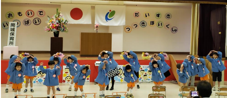
「WAになっておどろう」

照明が暗くなったのでエグチの携帯のカメラでは撮れなかったのですが、この後「筒城保育所のあゆみ」と題して、これまでの懐かしい写真がスクリーンに映し出されました。タイムスリップして、まるでその場にいたかのような気持ちにさせられました。そして最後は子供たちによる可愛らしいおゆうぎで、式を締めくくりました