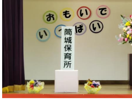
本当におもいでいっぱい…