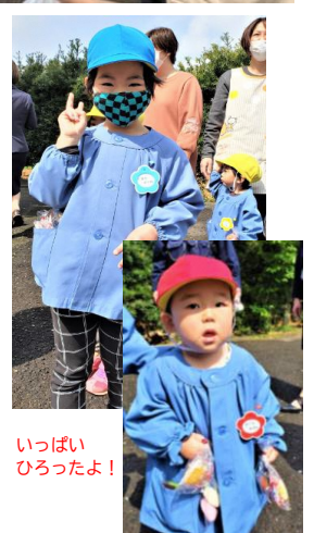
いっぱいひろったよ！