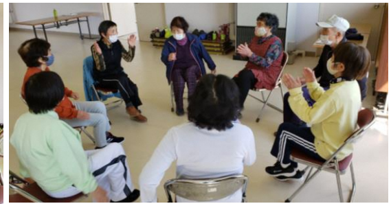
簡単な数字のリレーなど