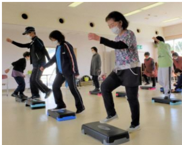
踏み台昇降運動や…