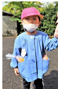
この子たちの明るい未来のために今大人たちができる事を。