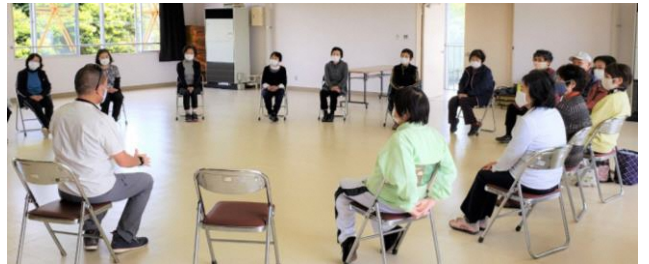
みなさんの自己紹介のあと、プログラムの説明があり…