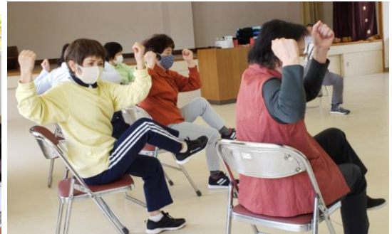
ストレッチからスタートです♪