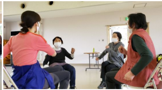
体を動かしながらのしりとり