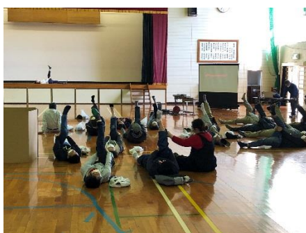
避難生活で大事な体操