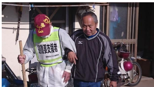
避難開始（要支援者宅まで迎えに）