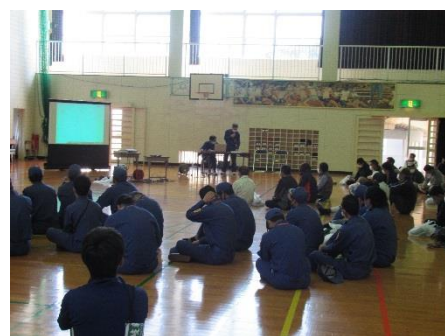
防災に関する講話