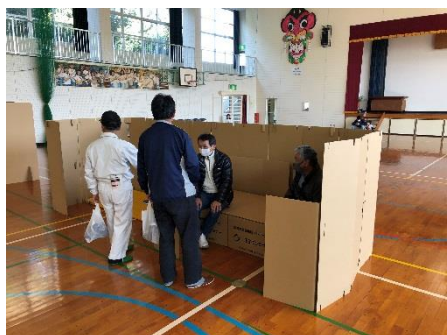
段ボールベッドと パーティション