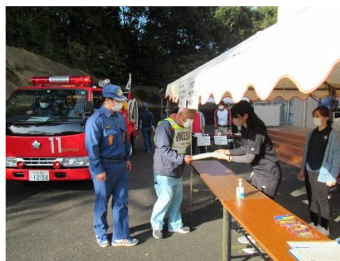
消防団も要支援者を送迎