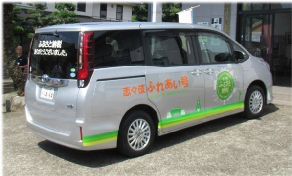
コミュニティバスのイメージ

交通の便が不自由な方などを対象に、ご自宅から地域内に直接移動できる「予約制コミュニティバス」の運行を検討しています。