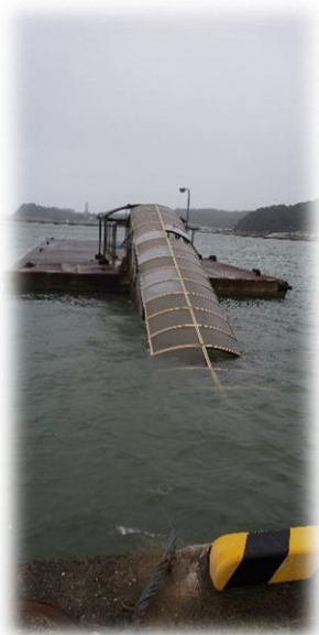
芦辺港 JF 乗り場