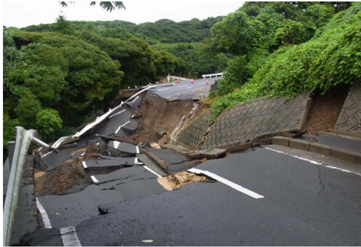
道路の陥没（市道横山線）

また、平成 29 年 7 月 6 日から 7 日にかけても、対馬海峡に停滞していた梅雨前線に向かって、南から暖かく湿った空気が流れ込んで、局地的に雷を伴った非常に激しい雨が降り、芦辺地区では連続雨量 416mm、最大時間雨量 119mm の猛烈な雨を観測した。いずれも「50 年に一度の記録的大雨」となった。被害状況は、人的被害はなかったが、道路、河川、農地、林地の災害や土砂崩れ、道路陥没・冠水、家屋の全壊、床下浸水などがあつた。