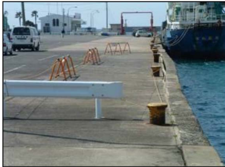
被災した岸壁(印通寺港)。壱岐市で震度 5 強

本市で震度 5 強を観測し、負傷者 2 人、住宅全壊 1 棟、港湾施設及び住家一部破損 16 棟の被害が発生した。