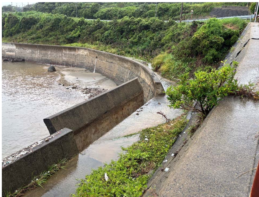
護岸の転倒（箱崎前浦漁港恵美須地区）

市内の被害状況については、人的被害はなかったものの、道路及び漁港施設等の公共施設のほか、農地や農業用施設でも多数の被害が発生した。また、住宅の裏山が崩れ、土砂の一部が宅内に流れ込む被害も複数報告があった。