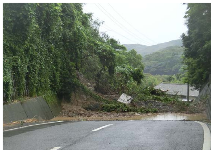
土砂崩れ（市道清東川津線）