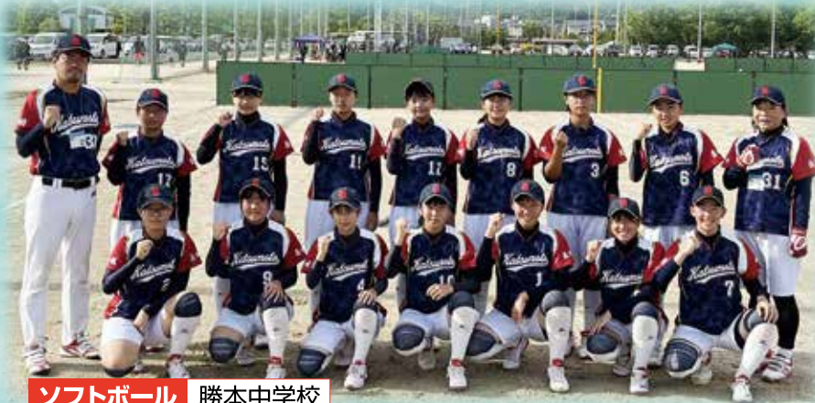
ソフトボール 勝本中学校