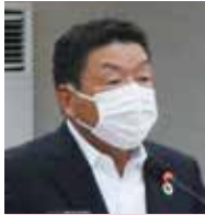
土谷 勇二 議員