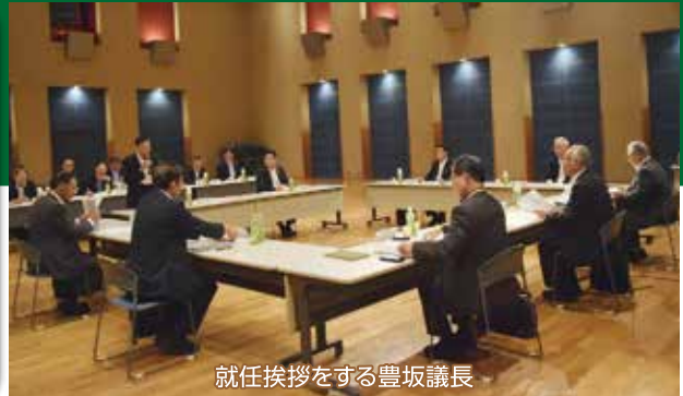
就任挨拶をする豊坂議長

去る7月7日、壱岐市において「令和5年度長崎県離島振興市町村議会議長会臨時総会」が開催されました。この議長会は8市2町（長崎市、佐世保市、平戸市、松浦市、対馬市、五島市、西海市、小値賀町、新上五島町、壱岐市）で構成されており、当日は7市2町の議長が一堂に会し、議長異動及び会務報告、歳入歳出決算の承認等について審議されました。また、役員改選により、壱岐市議会議長が新たに会長に就任しました。