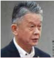
樋口 伊久磨 議員