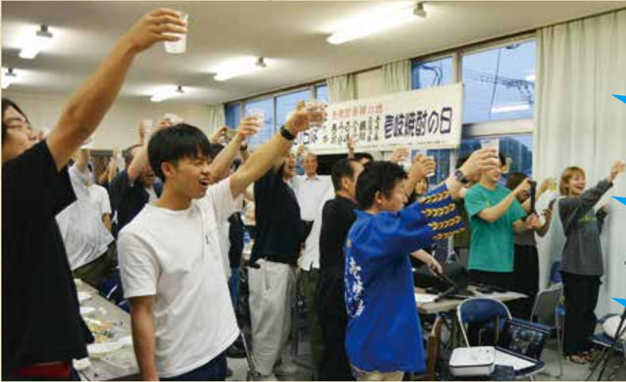
「7月1日は吉崎焼酎の日」乾杯イベント