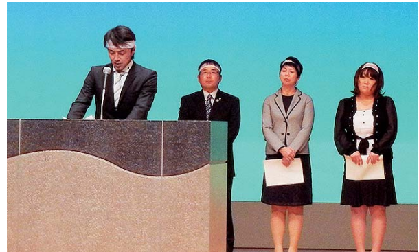
市民4代表による意見発表

国境離島の保全や人口維持、航路運賃の低廉化、雇用機会の拡充などを目的とした国境離島新法の制定に向け、4/25対馬市に引き続き、本市においても5/9総決起大会が開催されました。自民党離島振興特別委員長・谷川弥一衆議院議員はじめ金子参議院議員、中村知事等多くのご来賓出席の下、関係者約1300人が参加し、会場は溢れんばかりの熱気に包まれました。