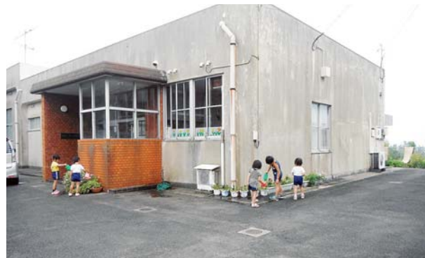
初山へき地保育所