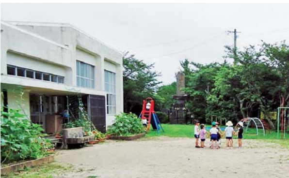
沼津へき地保育所

◎要望第2号「吉崎市奨学金貸与制度（併給）及び医療専門学校への修学資金制度の改善、見直しについての要望」は、平成23年陳情第4号、吉崎市奨学金貸与制度の改善を求める陳情は厳しい社会情勢の為、奨学金の償還が増大している中、併給による多額の貸与は避けるべきであるとし不採択となったが、現在長崎県内の併給状況を調査した結果、7市2町が併給していることから採択とする。