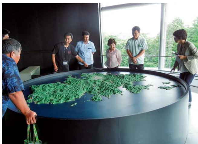
一支国博物館視察