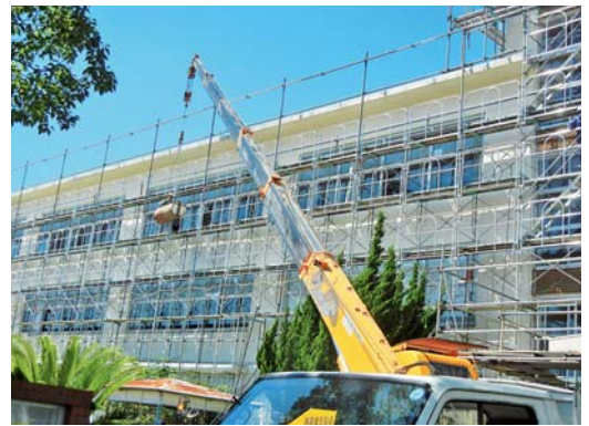
盈科小学校耐震工事

③投資的経費「公共事業」は30億円当初予算で計上。今回5億円を計上している。財政状況を考慮して対応していきたい。