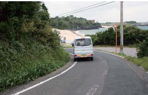
石田町錦山尻線(錦浜へ通じる道路)

③一支国博物館・県立埋蔵文化財センターに30数億円を充てているので、供給できない場合は知事と話す。