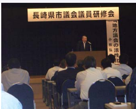
島原市有明総合文化センターにて

右記の4項目が主要講演内容であった。地方財政が厳しい中、議会のあるべき姿を真摯に模索して、住民自治の発展に寄与すべきと考える。