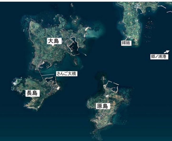
郷ノ浦町三島（大島・長島・原島）

現在の漁協が利用しているトイレを改修して利用してほしい。 平成22年度に県の新世紀水産育成事業で実施するようにしている。