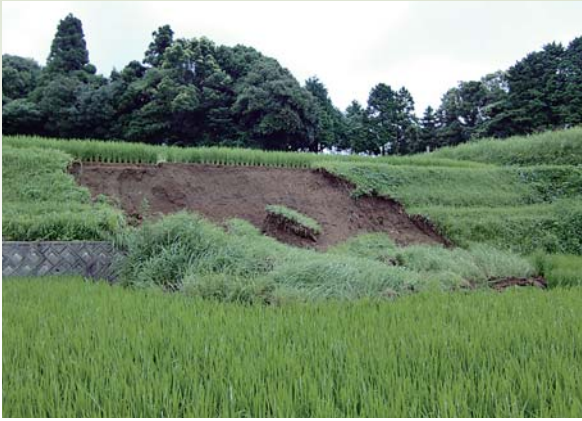
集中豪雨で崩れた農地