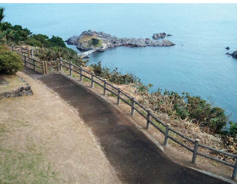
芦辺町「少式公園」展望台より