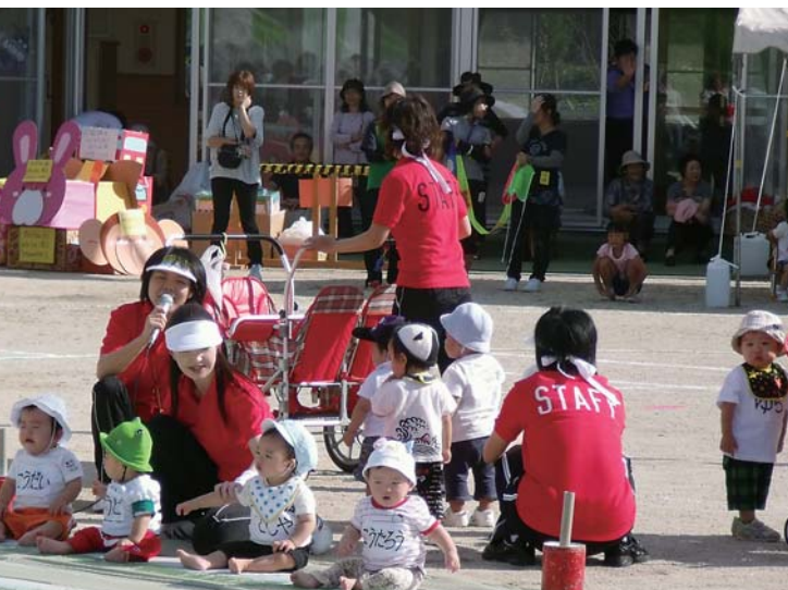
「0歳だってガンバルよ!」 武生水保育所運動会より

官民協働の取り組みが重要である。各組織と相談しながら、よりよき方向性を見出したい。