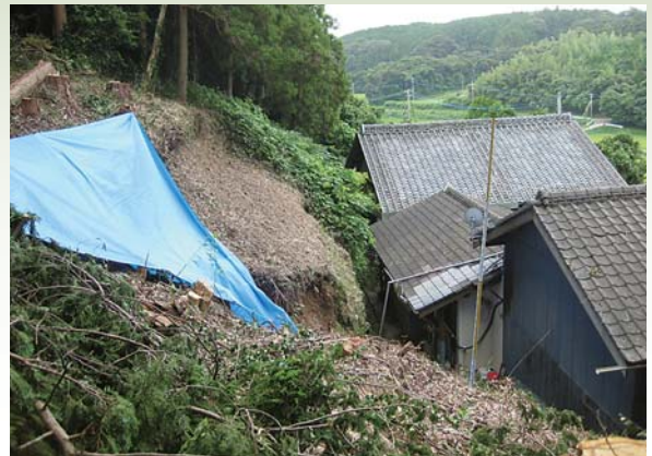
集中豪雨により裏山が崩壊