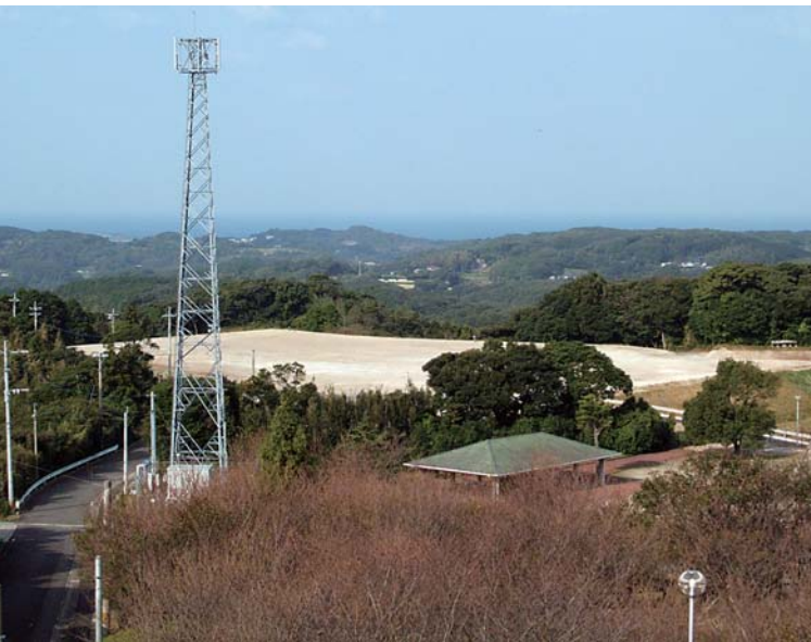
ごみ処理場建設予定地 (旧 芦辺町クリーンセンター跡)