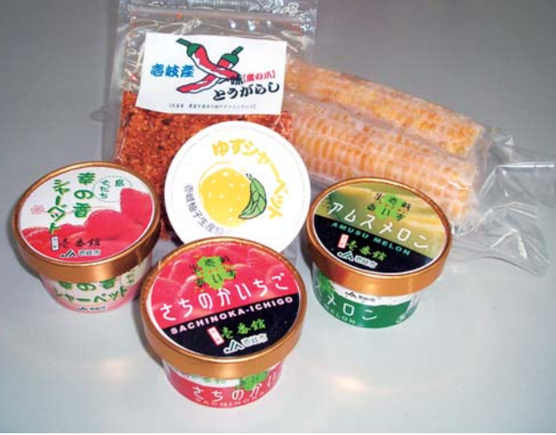
吉岐産の商品

①光ファイバー事業等は国の内示があり、長年の懸案であるため、実現に向け努力する。②日本農業を守る立場において、本市の関係団体と十分意見交換を行い、断固反対の意を示す。