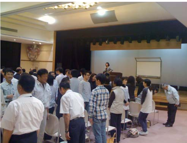
10月14日 吉岐市職員接遇マナー研修会

職員は私の意志に従って、業務を遂行している。市民対応の心構え、態度を十分指導し、住民サービスの向上に努力する。