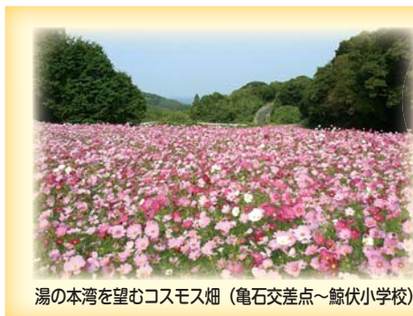
湯の本湾を望むコスモス畑（亀石交差点～鯨伏小学校）