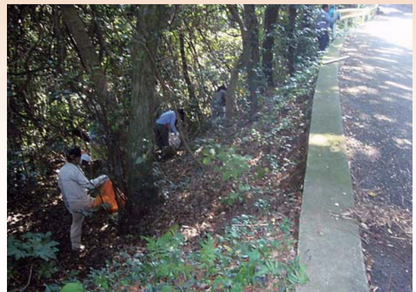
不法投棄物回収作業