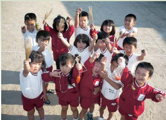
芦辺保育所ゆり組のお友だち