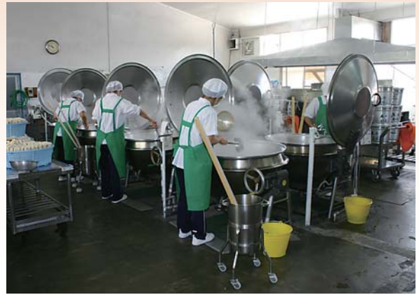
郷ノ浦給食センター調理場