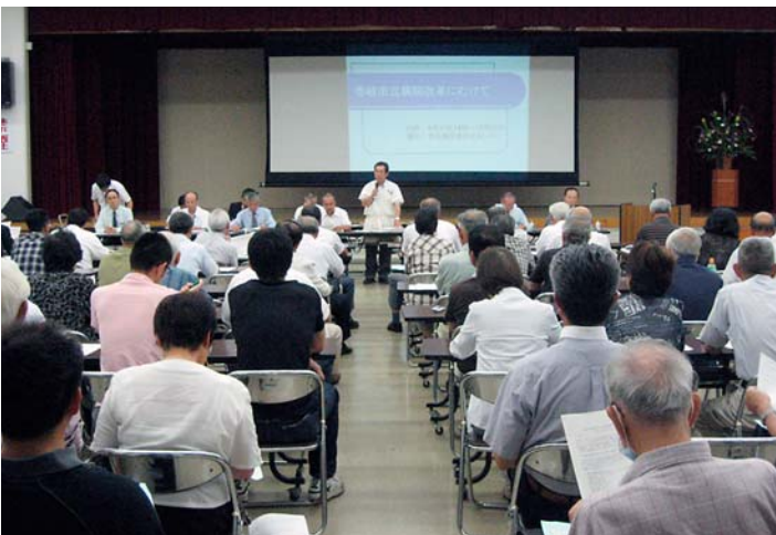
9月13日 病院改革タウンミーティング

⑥ 質問がなくなるまで夜なべしても市民皆さんの意見を十分聞く。 ※1 独立法人とは地方独立行政法人法で定める地方公共団体が設立する法人。役員員の身分は非公務員が一般的。理事長をおくこと。 ※2 全部適用とは現病院事業は地方公営企業法の財務規定等一部適用だが全て適用し、事業管理者をおくこと。