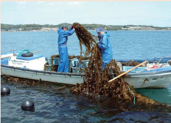
吉岐東部漁協のワカメ養殖