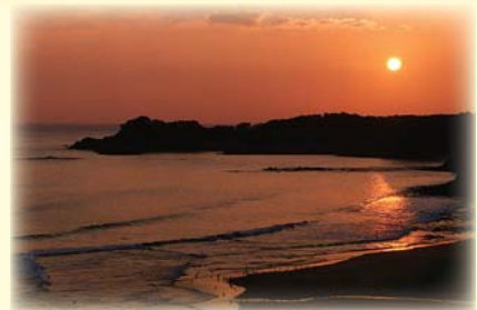
清石浜の朝陽（芦辺町）