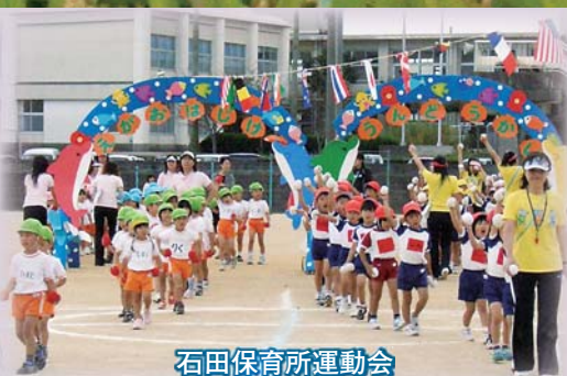
石田保育所運動会