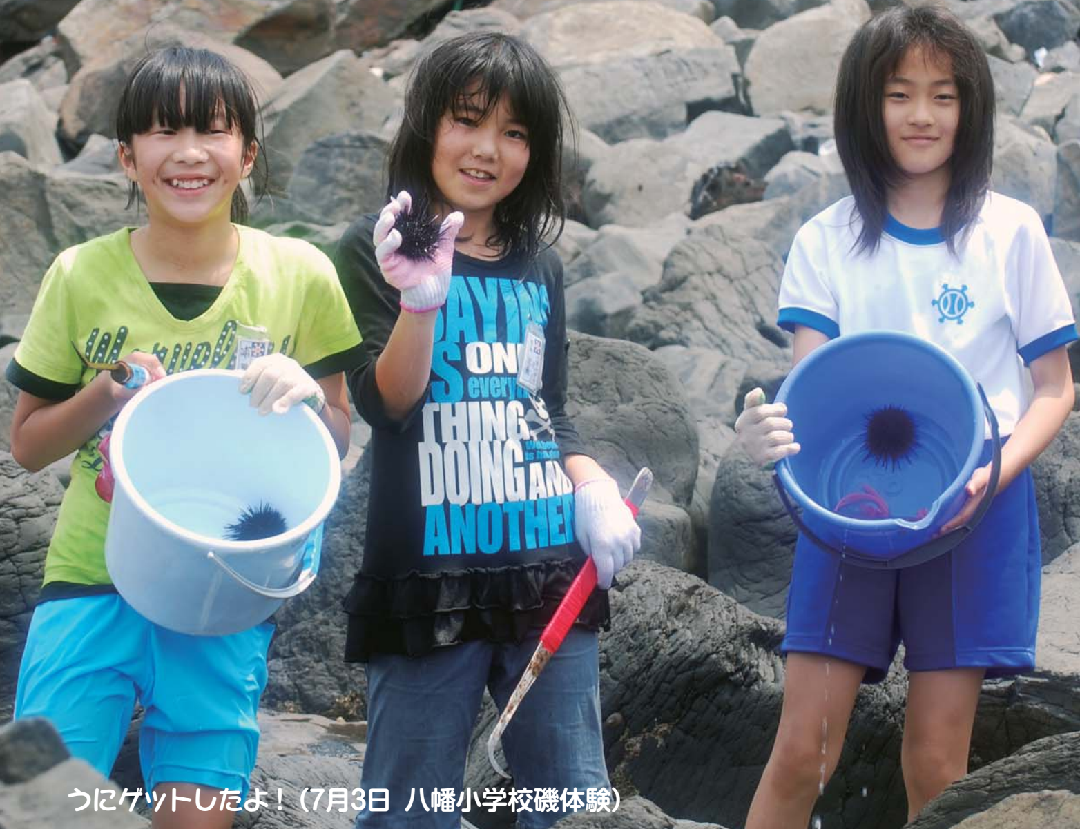
うにゲットしたよ！（7月3日 八幡小学校磯体験）

○6月定例会（6/2～6/16） 議案7件（平成21年度一般会計・特別会計補正予算ほか）、報告5件、陳情2件、承認1件、諮問2件（人権擁護委員候補者の推薦）を審査し、不採択となった陳情2件（※詳細は11ページに記載）を除き、原案可決した。継続審査としていた議案1件（※詳細は13ページに記載）は原案可決した。