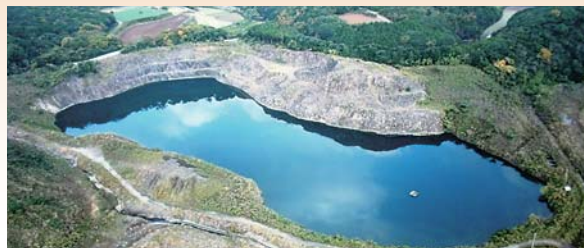
予備水源(勝本町布気・百合畑・片山触・芦辺町国分本村触)