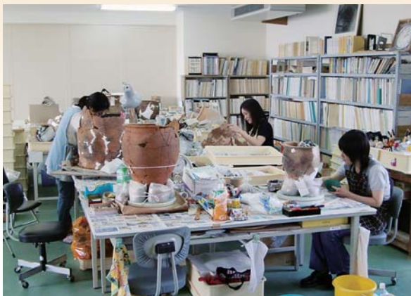
原の辻遺跡出土遺物の修復作業「文化財分室(旧公立病院)」