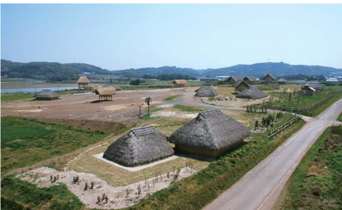
復元整備が進む原の辻遺跡

①平成18年12月の一般質問後の進捗状況は。 ②美しい自然景観等を保護するためにも、景観法に則った景観行政団体の承認を受け、原の辻遺跡周辺からも制定すべき。