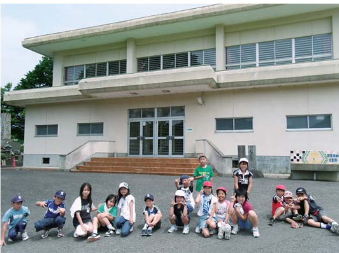
志原小学校体育館と子どもたち

見がある。今後、9月議会にて中学校設置条例の一部改正議案を提出できるように理解を求めている。 教育行政は教育委員会に委ねられているが、統廃合は市内全中学校同時スタートすべき。説明会には要請があれば行く。