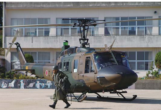
三島小学校(大島本校)に降り立つ陸上自衛隊員 (H19.11.9 吉岐市防災訓練)

人口増加・市財政への影響・経済面にも大きな効果がある。一方、敷地や住民感情の面で困難なところもあるが打診してみよう。