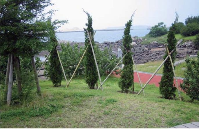
危険防止のため植栽が施された弁天崎公園