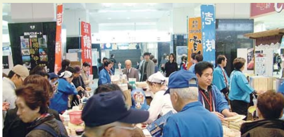
観光物産展「壱岐フェア」(博多駅)