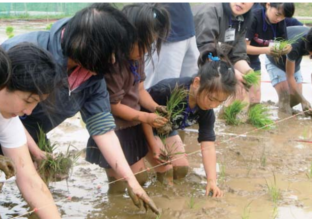
市民ボランティアによる古代米の田植え(6月13日 原の辻展示館前)