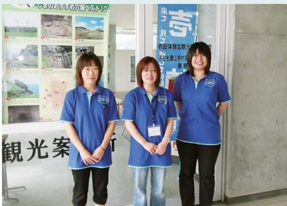
壱岐体験型観光受入協議会のスタッフ(芦辺港ターミナルビル2階)