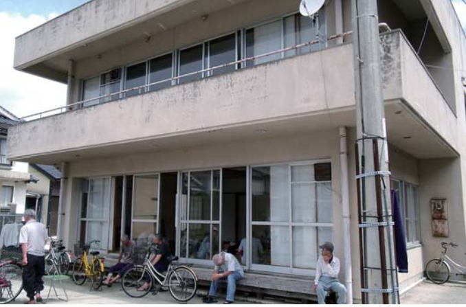
昭和55年3月建設の勝本町西部老人憩いの家

※同種ものが集まり、規模が大きくなることよって得られる利点。特に経済で、経営規模が大きいほど生産性や経済効率が向上することをいう。