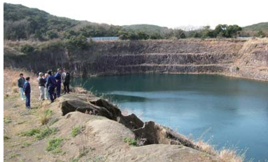
予備水源を調査（3月16日）

また、屋外広告物の許可を受けなければならぬ許可地域は、郷ノ浦町の都市計画区域内および壱岐空港周辺500メートルの範囲内に限られている。美しい自然景観や良好な眺望を保護する観点からも、今後は壱岐島内全域を対象とした、市独自の景観条例の制定について検討を進められるよう要望する。