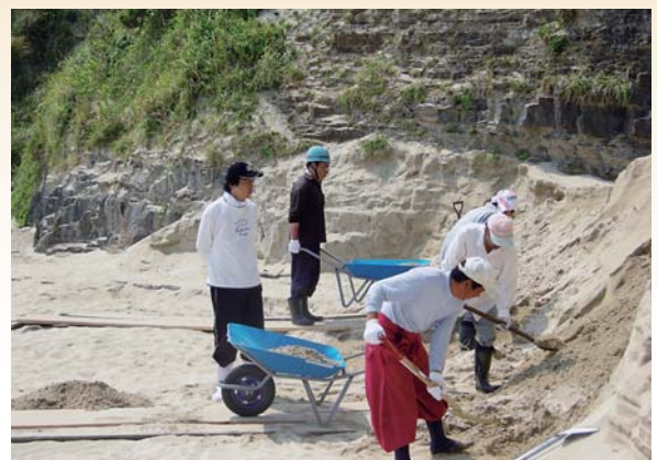
遊歩道の砂除去作業(辰ノ島海水浴場)

海水浴場・自然公園漂着ゴミ撤去(10箇所) 公園地内支障木伐採(7箇所) 海水浴場遊歩道砂等除去(2箇所)