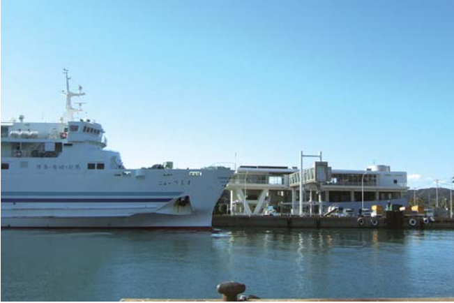
フェリー料金の恒久的な引き下げを！