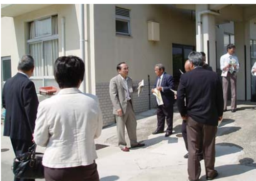
特養ホームを調査 (6月11日)

火葬場についても、建物内の空調、施設周辺の環境整備について、利用者および委託管理者からの意見についても早急に改善するよう申し入れをした。