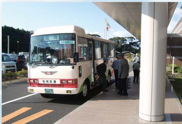
バス乗車カードの有効活用を

3月中旬に壱岐市道路整備基準の骨子策定と作業スケジュールを確認。 現在、各担当課で要望路線の整理および全国の整備基準要項策定事例を調査中。 7月中旬に資料の摺り合わせを行い、現地踏査実施後、10月末を目標に素案を仕上げる。