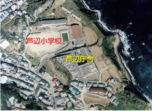
芦辺庁舎付近航空写真