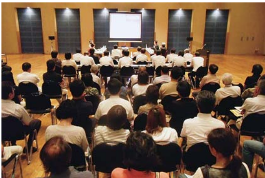
志岐市立病院改革委員会 (7月19日 志岐文化ホール)

高齢者へのタクシー料金助成に関する陳情の審査の結果、いずれも不採択とすべきものとした。不採択の理由は11ページに記載。