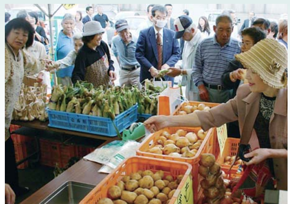
6月12日に開店した島の駅「壱番館」