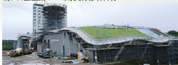
建設が進む一支国博物館(芦辺町鶴亀触)