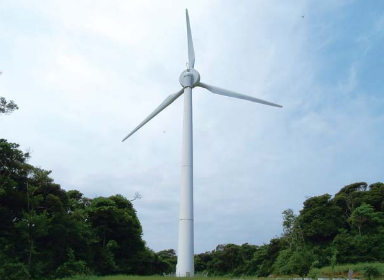
風力発電（芦辺町箱崎諸津触）