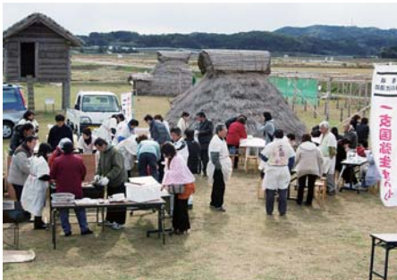
一支国弥生まつり「食祭」 (H20.11.17～23 原の辻展示館前)

助金247万円は、昨年の反省を踏まえ計画されており、10月17・18日に開催予定。