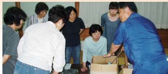
段ボールコンポスト普及説明会(6月27日 池田西上婦人会)