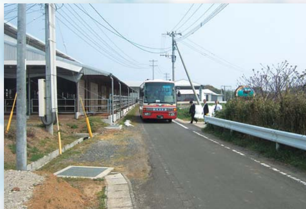
観光バスの利用も多い市道江角諸津線