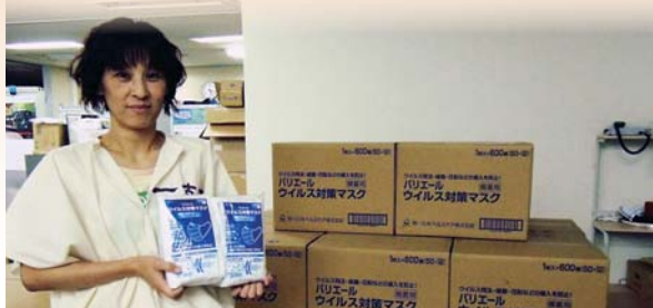
新型インフルエンザ対策用マスク

マスク・手指消毒薬購入 自動対外式除細動器(AED)購入 (市内公共施設10箇所)