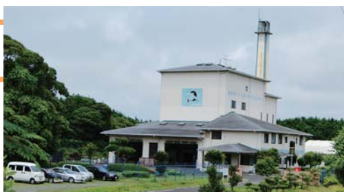
勝本町クリーン&リサイクルセンター