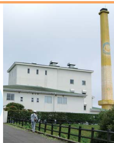
石田町環境美化リサイクルセンター