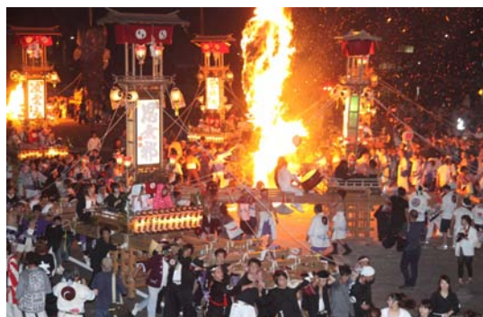
【能登のキリコ祭り】

日本海文化の交流拠点である能登半島は独自の文化を育み、数多くの祭礼が行われてきた。その白眉はキリコ祭りと総称される灯籠神事。夏、約200地区で行われ、能登を照らし出す。日本の原風景である素朴な農漁村で神輿とともに、最大で2トン、高さ15mのキリコを担ぎ上げ、激しく練り回る。祇園信仰や夏越しの神事から発生した祭礼が、地区同士でその威勢を競い合う中で独特な発展をし、そしてこれほどまでに灯籠神事が集積をした地域は唯一無二。夏、能登を旅すればキリコ祭りに必ず巡り会えると言っても過言ではなく、それは神々に巡り会う旅ともなる。