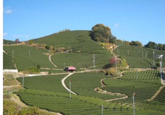
【宇治茶の郷 和東の茶畑】

この地域は、約800年間にわたり最高級の多種多様なお茶を作り続け、日本の特徴的文化である茶道など、我が国の喫茶文化の展開を生産、製茶面からリードし、発展をとげてきた歴史と、その発展段階毎の景観を残しつつ今に伝える独特で美しい茶畑、茶問屋、茶まつりなどの代表例が優良な状態で揃って残っている唯一の場所である。