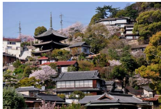
【春の天寧寺三重塔】

迷路に迷い込んだかのような路地や、坂道を抜けた先に突如として広がる風景は、限られた空間ながら実に様々な顔を見せ、今も昔も多くの人を惹きつけてやまない。