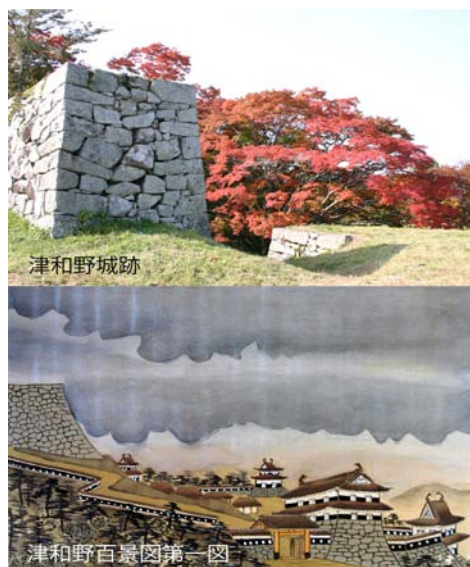
【津和野城現況＋百景図】

幕末の津和野藩の風景等を記録した「津和野百景図」には、藩内の名所、自然、伝統芸能、風俗、人情などの絵画と解説が100枚描かれている。明治以降、不断の努力によって町民は多くの開発から街を守るとともに、新しい時代の風潮に流されることなく古き良き伝統を継承してきた。百景図に描かれた当時の様子と現在の様子を対比させつつ往時の息吹が体験できる稀有な城下町である。