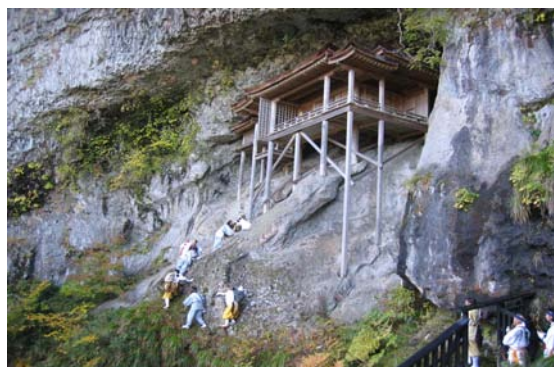
【開山 1300 年の投入堂特別参拝】

参拝の前に心身を清める場所として三徳山参詣の拠点を担った『三朝(みささ)温泉』は、三徳山参詣の折に白狼により示されたとの伝説が残り、温泉発見から900年を経て、なお、三徳山信仰と深くつながっている。今日、三徳山参詣は、断崖絶壁での参拝により「六根（目、耳、鼻、舌、身、意）」を清め、湯治により「六感（観、聴、香、味、触、心）」を癒すという、ユニークな世界を具現化している。