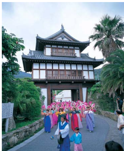
【金石城跡（対馬アリラン祭）】

国境の島ならではの融和と衝突を繰り返しながらも、連綿と交流が続くこれらの島は、国と国民と民の深い絆が感じられる稀有な地域である。