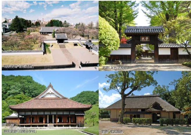
【旧弘道館・足利学校跡・旧閉谷学校・咸宜園跡】

我が国では、近代教育制度の導入前から、支配者層である武士のみならず、多くの庶民も読み書き・算術ができ、礼儀正しさを身に付けるなど、高い教育水準を示した。これは、藩校や郷学、私塾など、様々な階層を対象とした学校の普及による影響が大きく、我が国が非西欧社会の中でいち早く近代化を達成した大きな原動力となった。