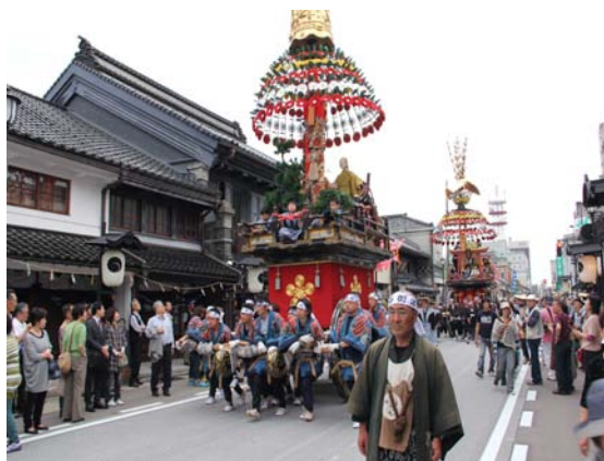
【重伝建地区山町筋を巡行する高岡御車山】

高岡は商工業で発展し、町民によって文化が興り受け継がれてきた都市である。高岡城が廃城となり、繁栄が危ぶまれたところで加賀藩は商工本位の町への転換政策を実施し、浮足立つ町民に活を入れた。鋳物や漆工などの独自生産力を高める一方、穀倉地帯を控え、米などの物資を運ぶ良港を持ち、米や綿、肥料などの取引拠点として高岡は「加賀藩の台所」と呼ばれる程の隆盛を極める。町民は、固有の祭礼など、地域にその富を還元し、町民自身が担う文化を形成した。純然たる町民のとして発展し続け、現在でも町割り、街道筋、町並み、生業や伝統行事などに、高岡町民の歩みが色濃く残されている。