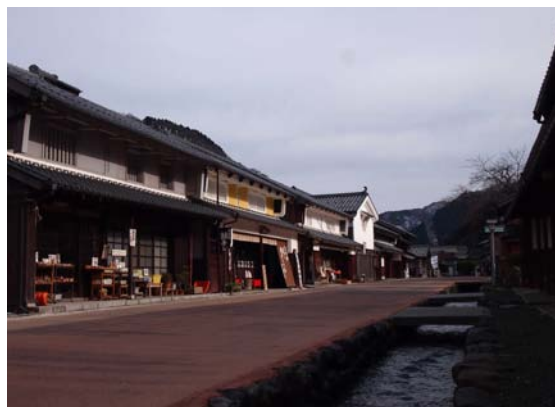
【重伝建地区熊川宿】

近年「鯖街道」と呼ばれるこの街道群沿いには、往時の賑わいを伝える町並みとともに、豊かな自然や、受け継がれてきた食や祭礼など様々な文化が今も息づいている。