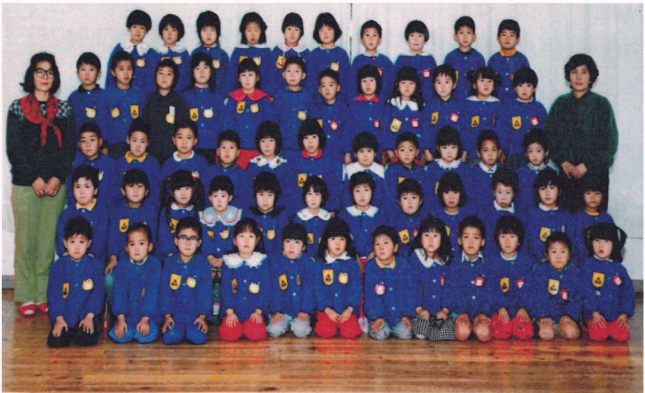
第28回卒園記念 渡良保育所 平成2年3月