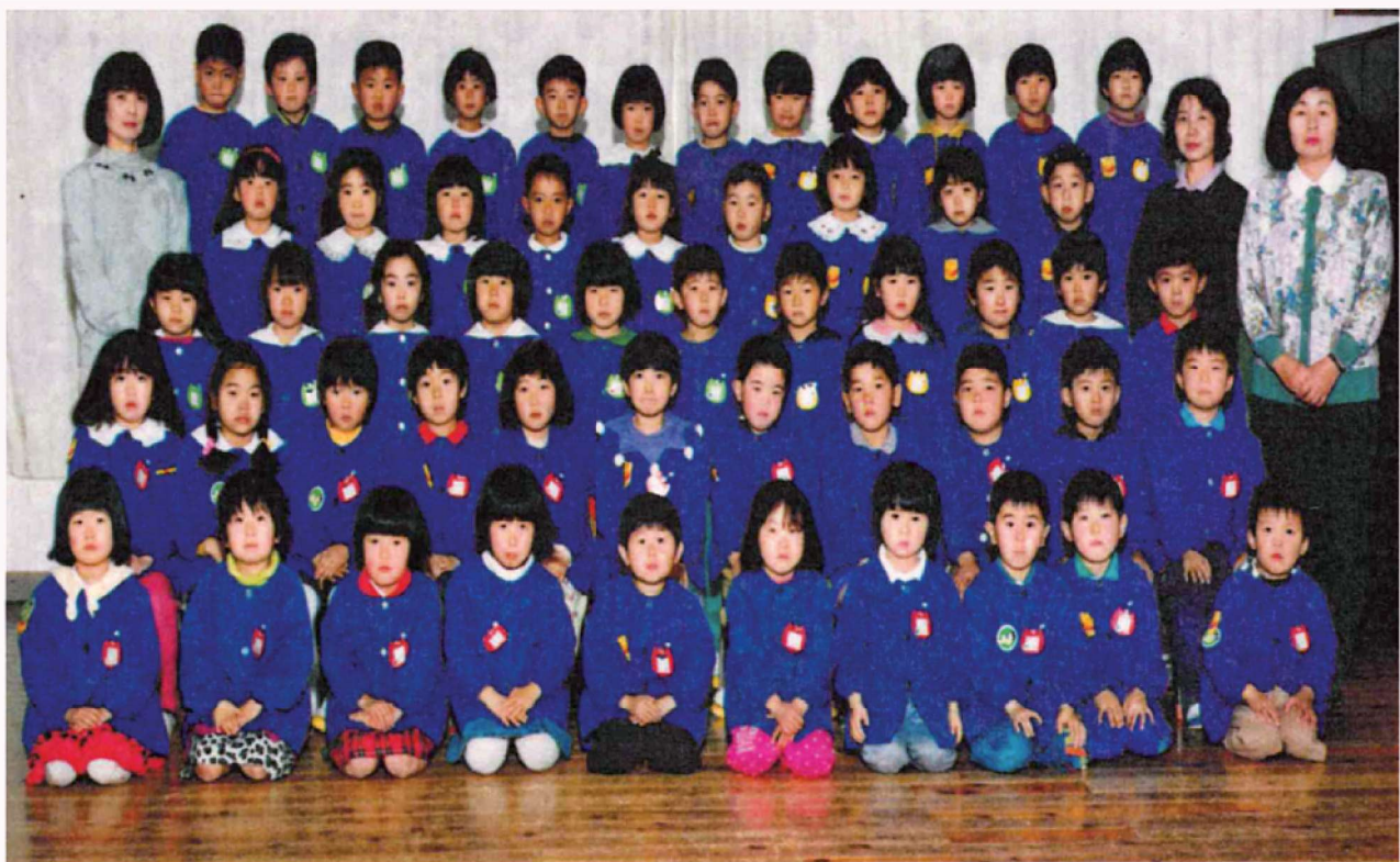
第32回卒園記念 渡良保育所 平成6年3月