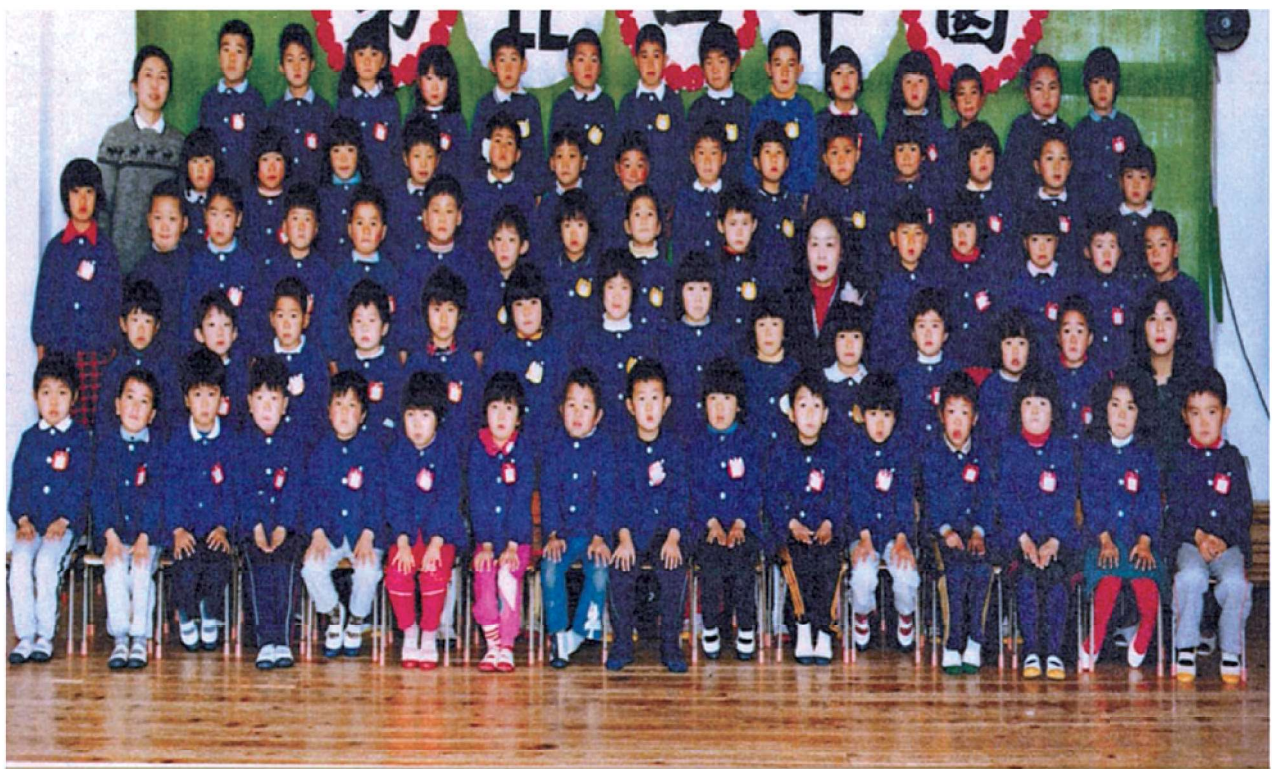
第 22 回 卒 園 記 念 渡 良 保 育 所 昭 和 59 年 3 月