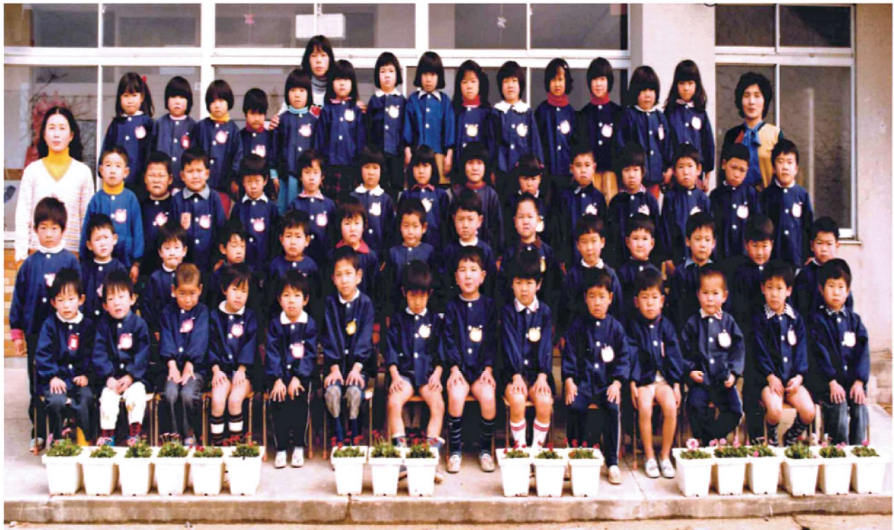
第21回 卒園記念 渡良保育所 昭和58年3月