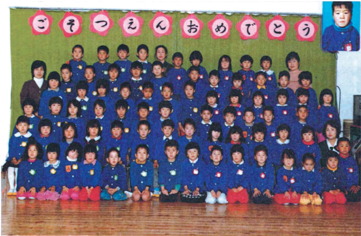
第24回卒園記念 渡良保育所 昭和61年3月