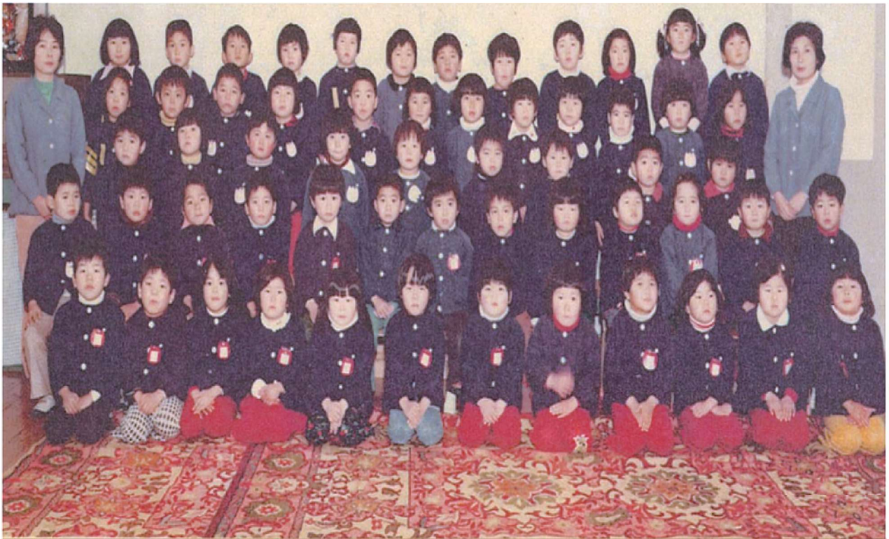
第16回卒園記念 渡良保育園 昭和53年3月