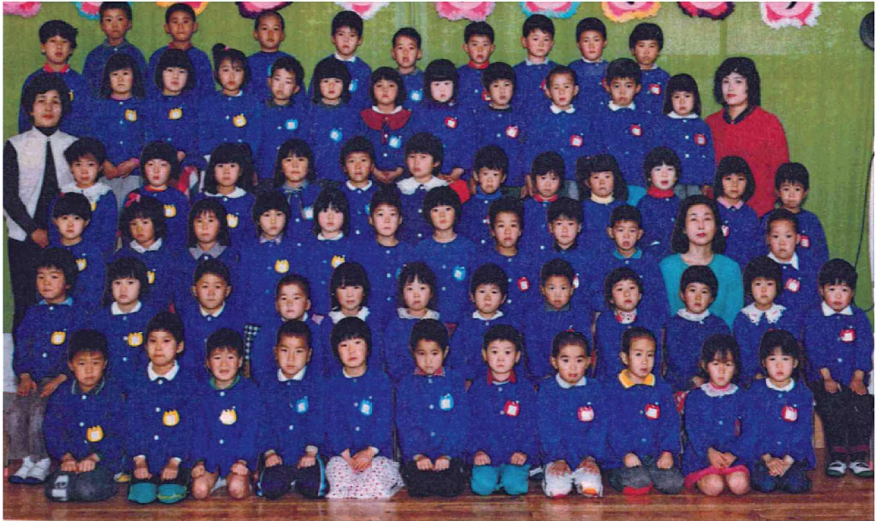
第25回卒園記念 渡良保育所 昭和62年3月