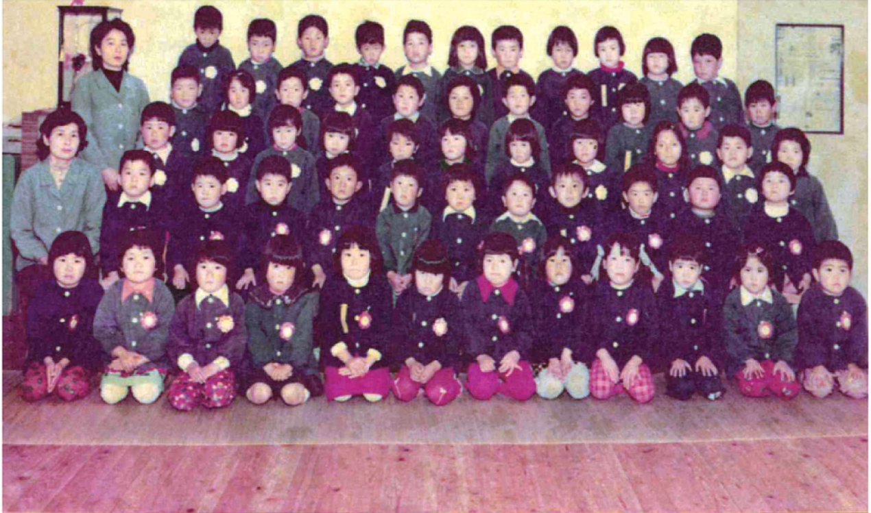
第15回卒園記念渡良保育園 昭和52年3月24日