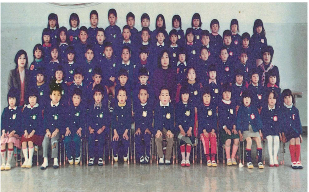
第20回卒園記念 渡良保育所 昭和57年3月