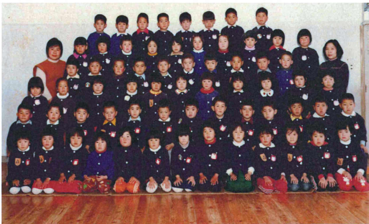
第18回卒園記念 渡良保育所 昭和55年3月