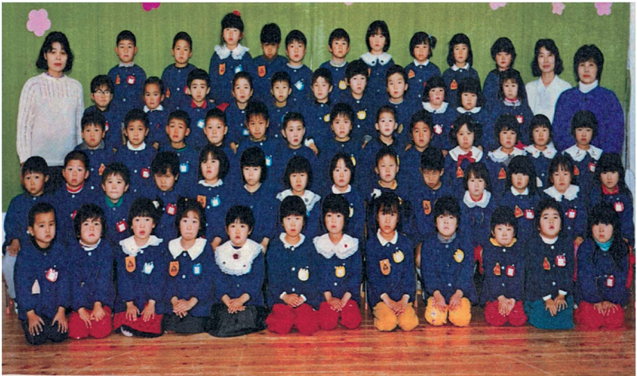
第27回卒園記念 渡良保育所 平成元年3月