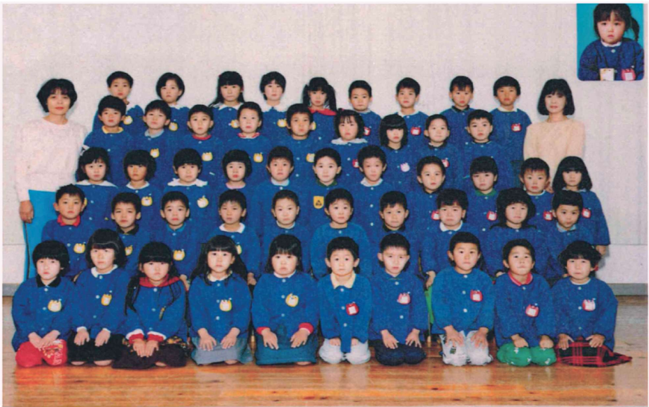
第29回 卒園記念 渡良保育所 平成3年3月