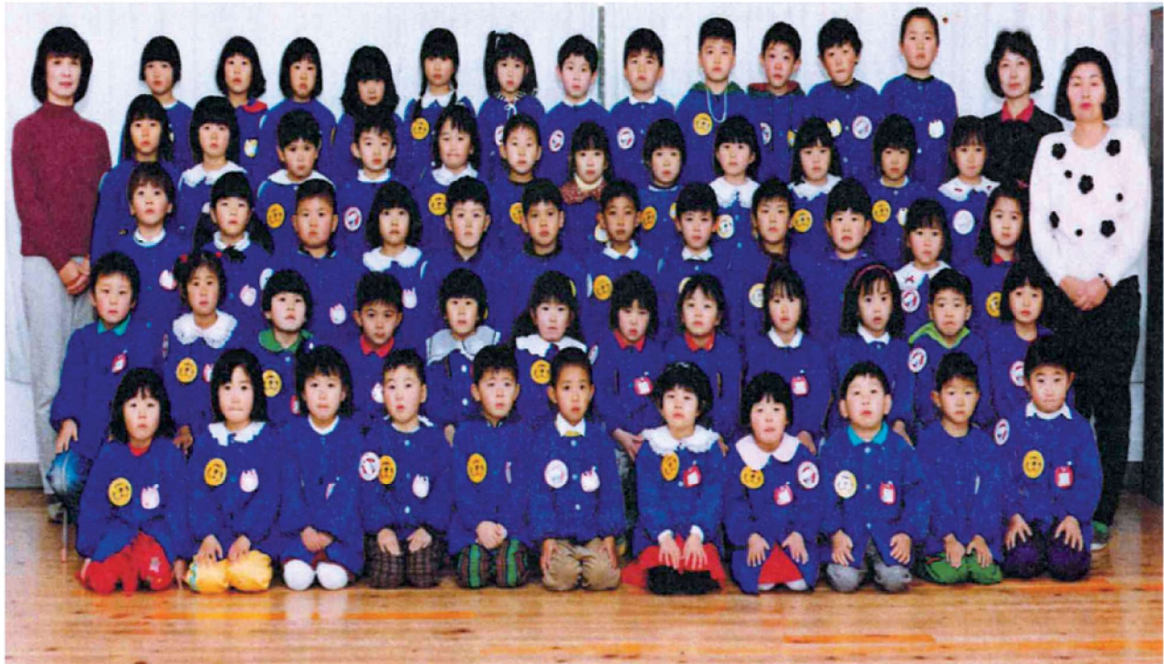
第31回卒園記念 渡良保育所 平成5年3月