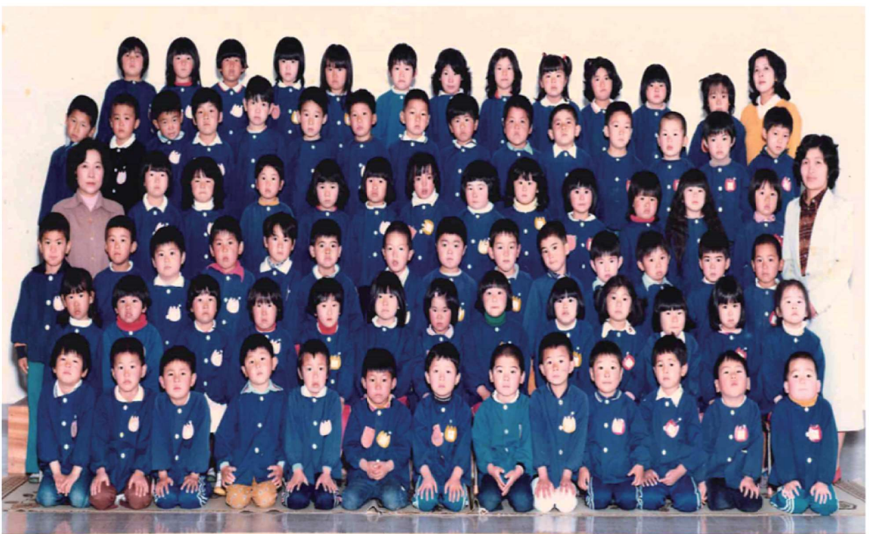
第19回卒園記念 渡良保育所 昭和56年3月