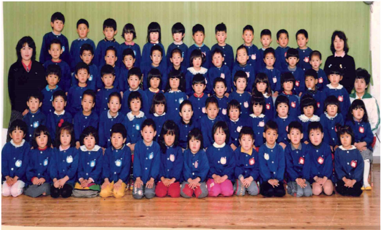
第26回卒園記念 渡良保育所 昭和63年3月