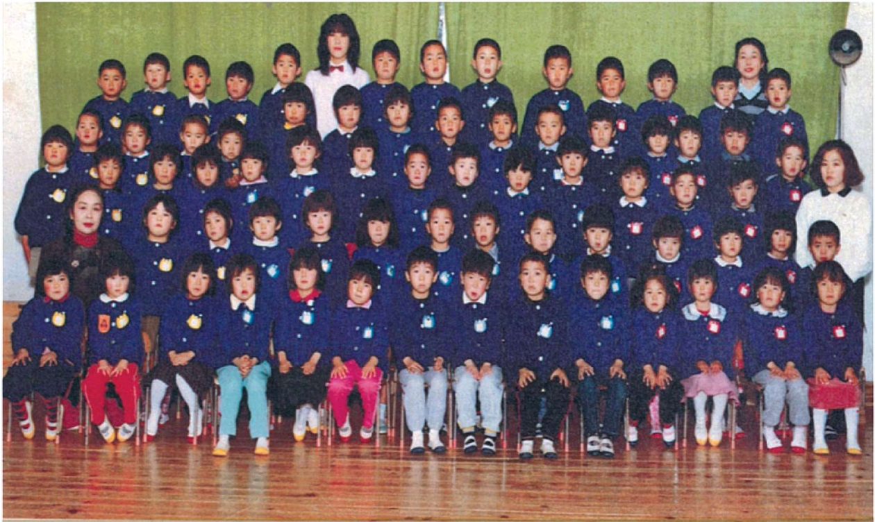
第23回卒園記念 渡良保育所 昭和60年3月