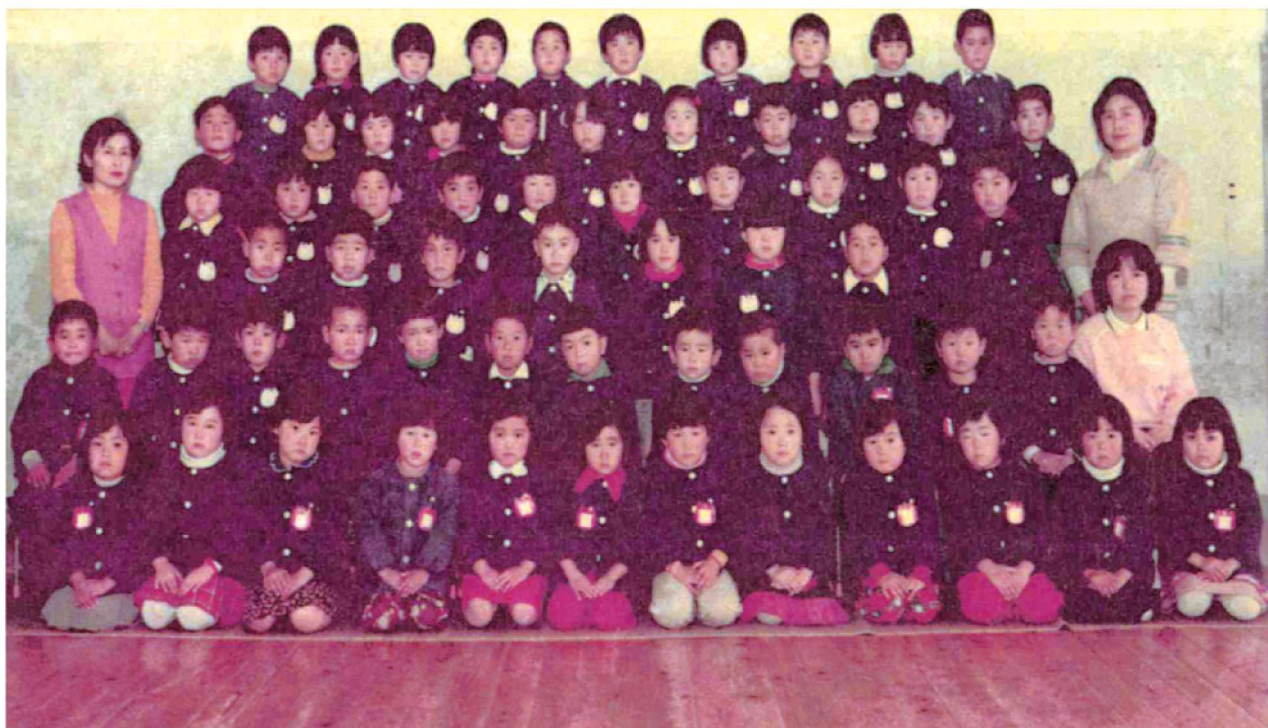
第17回卒園記念 渡良保育所 昭和54年3月