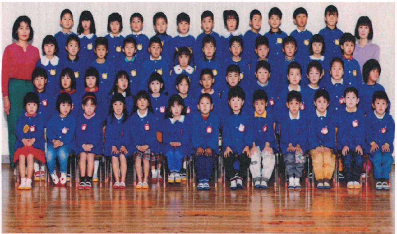
第30回 卒園記念 渡良保育所 平成4年3月