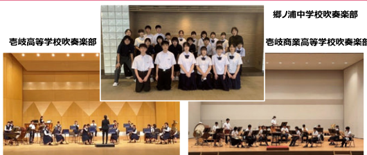
郷ノ浦中学校吹奏楽部