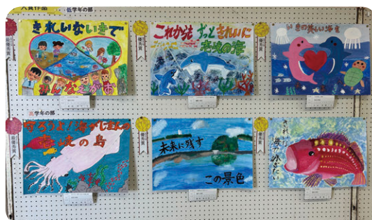
ポスターコンクール入賞作品