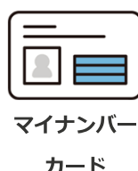
マイナンバー カード