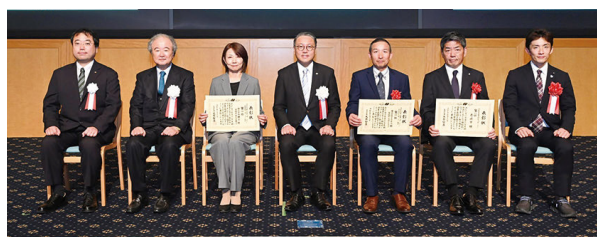
(株式会社イチヤマ様右から3番目)

これも市民皆様が健康のために歩かれた、努力の賜物です。今後ご自身の健康のために継続していただけるよう健康づくり事業の充実に努めてまいります。