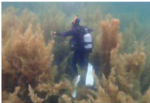
繁茂した藻場の様子