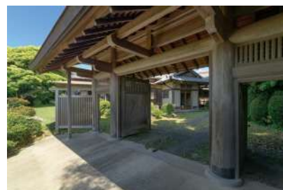
碧雲荘（旧熊本家門・住宅）

〒811-5215 長崎県壱岐市石田町石田西触 1486-1・1434-3 (壱岐市社会福祉協議会石田支所付近)