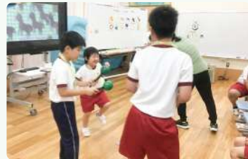
小学部：音楽の授業の様子

虹の原特別支援学校壱岐分校小中学部(盈科小学校内)および高等部(壱岐高校内)では、長崎っ子の心を見つめる教育週間の一環で、6月22日(月)から26日(金)まで(小中学部)、6月29日(月)から7月3日(金)まで(高等部)の期間で学校公開を実施します。この期間、通常の授業だけでなく、命の大切さに関すること、人権に関することについての授業も計画しています。特別支援学校の教育に興味がある方や、子どもたちの様子を見たい方は、ぜひこの機会に特別支援学校の授業を見学してみませんか。何か問い合わせなどありましたら、気軽にお電話ください。