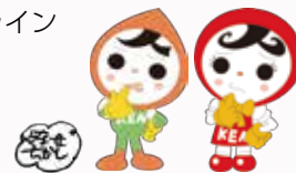
人権イメージキャラクター 人KENまもる君・人KENあゆみちゃん