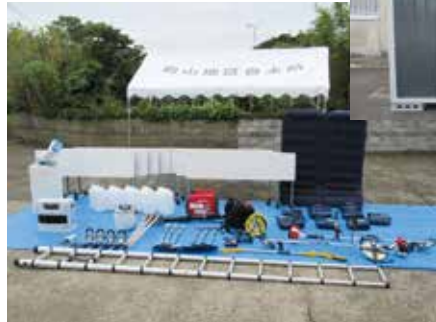
防災資機材（初山地区自主防災組織）