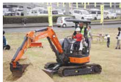
※画像は平成30年度開催時のもの

また、壱岐市「消防団フェスタ2023」も同時刻で合同開催します。消防音楽隊によるステージイベントやはしご車の試乗、各種体験コーナーを用意しています。イベントの最後に餅まきも実施します。イベント内容は、自治公民館の回覧板でご確認ください。