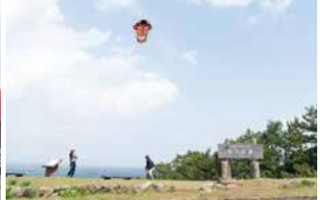
少弐公園での凧揚げの様子