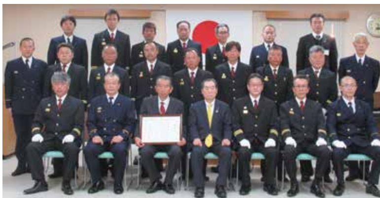
消防団辞令交付式 集合写真