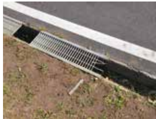
展望台入口付近の状況