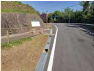
令和 5 年 4 月中旬に発生した市道岳の辻線