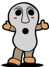
壱岐市 人面石くん