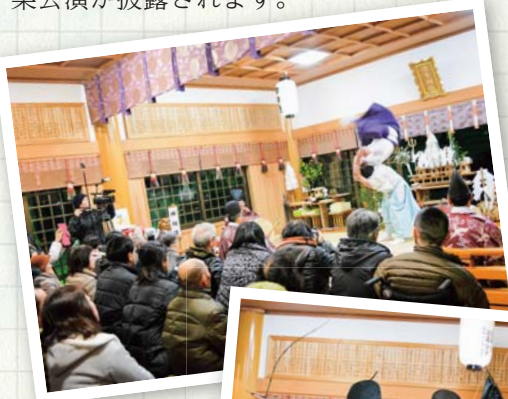
アクロバティックな舞いも

厳肅かつ神秘的な雰囲気の中、住吉神社で約6時間にわたり沓岐大大神楽が奉納されました。国の重要無形民族文化財に指定されている沓岐神楽は、毎年8月初旬にも、筒城浜ふれあい広場ステージで大大神楽公演が披露されます。