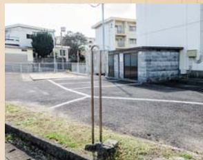
物部布都神社跡地