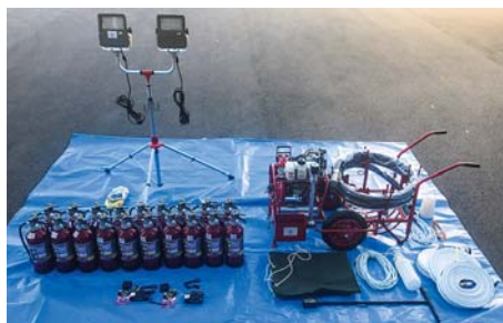
地域防災組織育成事業 久喜西部婦人防火クラブ

このたび、地域防災組織育成事業により、久喜西部婦人防火クラブが、消火活動及び予防活動に使用するD-1級軽可搬消防ポンプ一式、投光器セット、粉末消火器、デジタルカメラを整備しました。