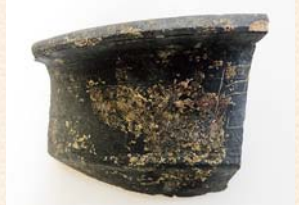
▲日本初！「周」の文字が書かれた瓦質土器片