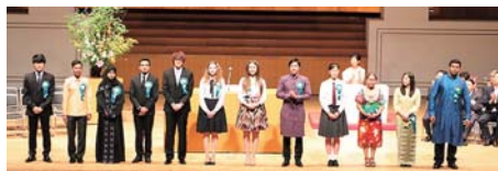
前回大会（茨城県つくば市）の様子