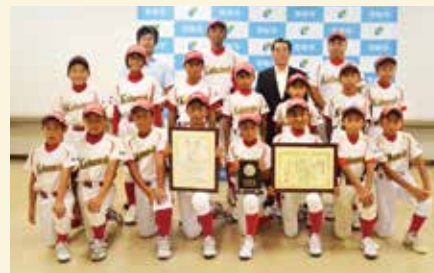
勝本少年野球クラブ