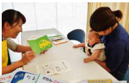
4、5か月児のお子さんには 絵本のプレゼント