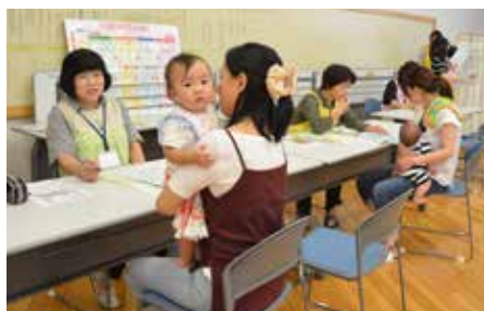
問診や、保健師・栄養士との 育児相談ができます