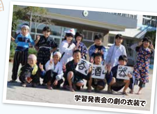
学習発表会の劇の衣装で

柳田小学校の3年生は男子8名、女子4名の12名です。「おはようございますー!」校門をくぐるとまず、大きな声で挨拶をします。全員が歩いて登校し、頭も体もスイッチオン。何事にも全力で取り組む3年生の一日がスタートします。