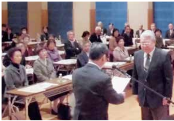
12月1日に開催された「苓岐市民生委員児童委員・主任児童委員委嘱状等伝達式」の様子

12月1日に苓岐市民生委員・児童委員が委嘱され、3年間を任期とする新しい委員の皆さんが決まりました。 民生委員・児童委員は、地域・行政・学校などと連携しながらそれぞれの地区で市民皆さんの「福祉の窓口」として活動されます。 困りごとや心配ごとなどお気軽にご相談ください。