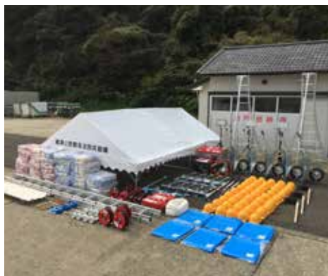
防災資機材 (諸津公民館自主防災組織)

このたび、諸津公民館自主防災組織が28年度コミュニティ助成事業《地域防災組織育成助成事業》（宝くじの助成金で実施）を活用し、防災資機材の整備を行いました。