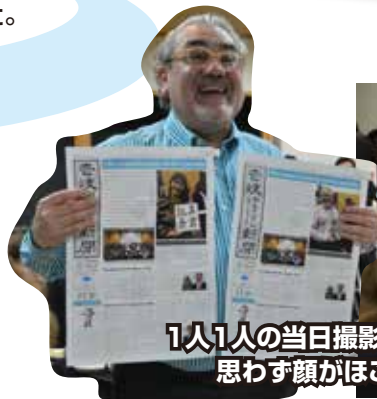
1人1人の当日撮影した写真が入った新聞に、思わず顔がほころぶ外交官の皆さん