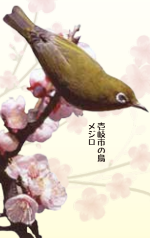
吉岐市の鳥 メシロ

結びに、この1年が皆様にとりまして幸多き素晴らしい年となりますことを、心からお祈り申し上げます。新年のご挨拶といたします。