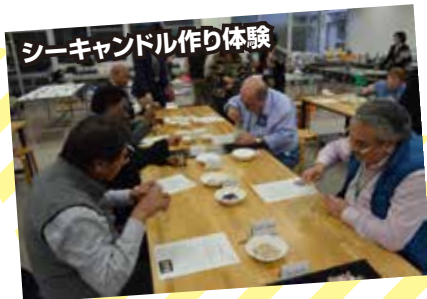
シーキャンドル作り体験