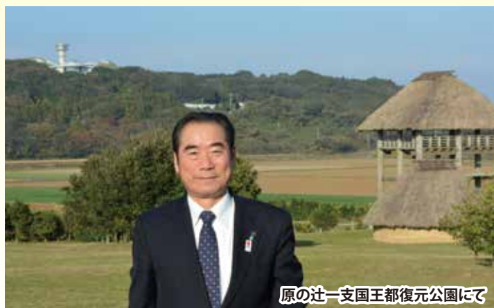
原の辻一支国王都復元公園にて