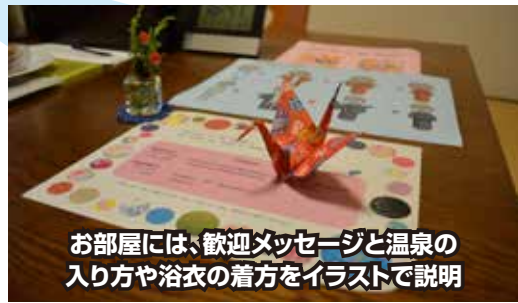
お部屋には、歓迎メッセージと温泉の入り方や浴衣の着方をイラストで説明

国民宿舎吉崎島荘で、歓迎レセプションを行いました。英会話・ダンスを学んでいるマチダックスのみなさんによる歓迎に始まり、富士ゼロックス株式会社による“吉崎おもてなし新聞”のプレゼント、豊かな吉崎の幸でおもてなししました。