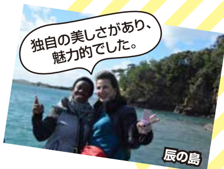
独自の美しさがあり、魅力的でした。