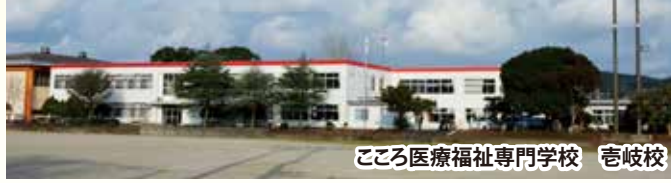
こころ医療福祉専門学校 吉岐校

福祉士養成校である「こころ医療福祉専門学校吉岐校」につきまして、校舍として活用する旧鯨伏中学校の耐震改修工事が完了し、昨年12月1日に開校式が行われました。専門学校としての開校は、本年4月1日からとなりませんが、昨年12月1日から本年2月28日までの間、求職者支援訓練として「介護職員初任者研修」が行われております。高齢化社会を迎え、社会問題となっている介護分野における人材確保に、大きな役割が期待されます。