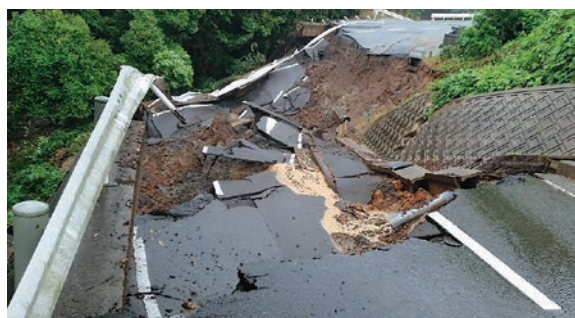
被災道路(勝本町坂本触)

6月29日～30日及び7月6日～7日の集中豪雨により被災した農地及び農業用施設、公共土木施設等の災害復旧を行う。