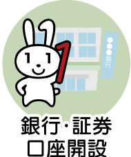
銀行・証券 口座開設