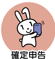
確定申告 (2024年度より)