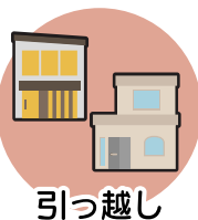
引っ越し (2023年7月頃より)