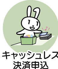
キャッシュレス 決済申込